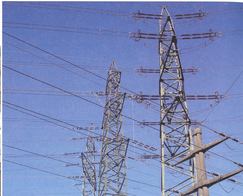
Bevorzugte Wasserkraft (Foto links): Das Reusskraftwerk bei Windisch (1,5 MW Leistung) und auch bis zu sieben Mal leistungsfähigere Wasserkraftwerke können bei einer Sanierung und bei einem Ausbau mit der kostendeckenden Einspeisevergütung für «Kleinkraftwerke» rechnen. Die Schweizerische Energie-Politik (Foto rechts) im Spannungsfeld zwischen dezentraler oder zentralistischer Stromerzeugung mit Notwendigkeit zum Ausbau des Höchstspannungsnetzes.

auf 176 MW und bei Mehrkosten unter 30 Rp./kWh dürfte die Gesamtleistung auf 300–400 MW ansteigen. Pro Einwohner liegt die Schweiz nach Erreichen dieses Zieles, also frühestens in 5–10 Jahren, bei einer Solarstromleistung von 40–50 Watt. Im Vergleich werden wir dann gerade mal die Hälfte der Leistung von Bayern pro EinwohnerIn im Jahre 2006 erreicht haben! Bayern und die deutsche Solarwirtschaft werden bis zu diesem Zeitpunkt aber, bei gleichblei-