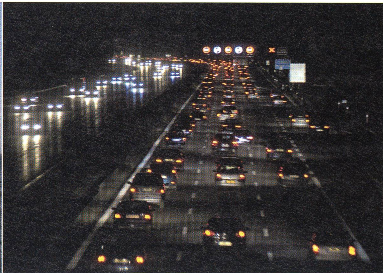
Erdöl: Da kommt es noch weit übers Meer, aber für wie lange noch? Und oft verpufft das Erdöl so schnell über Nacht.

rund 60 US $ pro Barrel bis ins Jahr 2015 und auf nur einem minimal höheren Preis von 62 US $ bis ins Jahr 2030. Unter Berücksichtigung, dass sich der Ölpreis seit bereits 2 Jahren über 60 $ pro Barrel und seit einem halben Jahr über 80 $ bewegt, erscheint es schon fast peinlich, noch von 60 $ fürs Barrel in 10 bis 20 Jahren zu prognostizieren. Schon aus diesem Grund sollten die IEA-Szenarien mehr als nur kritisch hinterfragt werden.