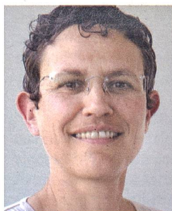
Von SUSAN BOOS

Schweden hat 1980 den Atomausstieg beschlossen und angeblich – wie die AKW-Lobby gerne suggeriert – das Atommüllproblem «gelöst». Doch noch immer laufen zehn Reaktoren, und das vorliegende Endlagerkonzept sowie die Technologie dahinter wird als veraltet kritisiert. Das schwedische Umweltgericht wird entscheiden müssen.