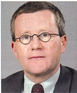
Von RUEDI RECHTSTEINER Ökonom Dr. rer. pol. und SP-Nationalrat rechtsteiner@rechtsteiner-basel.ch

Dank internationalen Abrüstungsverträgen erhält Russland Milliardenhilfe aus dem Westen für die Entsorgung von Atom-U-Booten und Chemiewaffenlagern. Hunderte weiterer Atomanlagen werden aber mangels Geld nicht saniert. Putin will die Atomindustrie ausbauen, ohne die Altlasten zu beseitigen. Für die Bevölkerung bedeutet dies: mehr Risiken, Krankheit und Tod. Der Westen schaut zu, und manche Akteure (Frankreich, Kanada) hoffen auf gute Geschäfte.