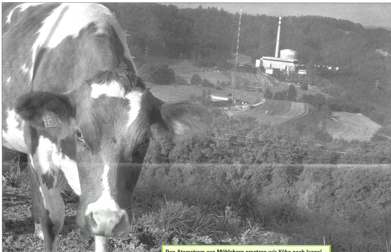
Den Atomstrom aus Mühleberg ersetzen wir Kühe noch lange!

Der Druck auf die schweizerische Landwirtschaft steigt. Die Schweizer Bauern müssen nach neuen Erwerbsmöglichkeiten suchen. Biostrom aus Biogasanlagen ist eine davon. Heute gibt es 67 Biogasanlagen auf Bauernhöfen. Das Potenzial liegt bei gegen 1000 Anlagen. Die Förderung von erneuerbarem Strom ab Hof wird vom Bauernverband bis hin zu den Biobauern befürwortet. Nur die Stromwirtschaft will keinen Biostrom und keine Konkurrenz.