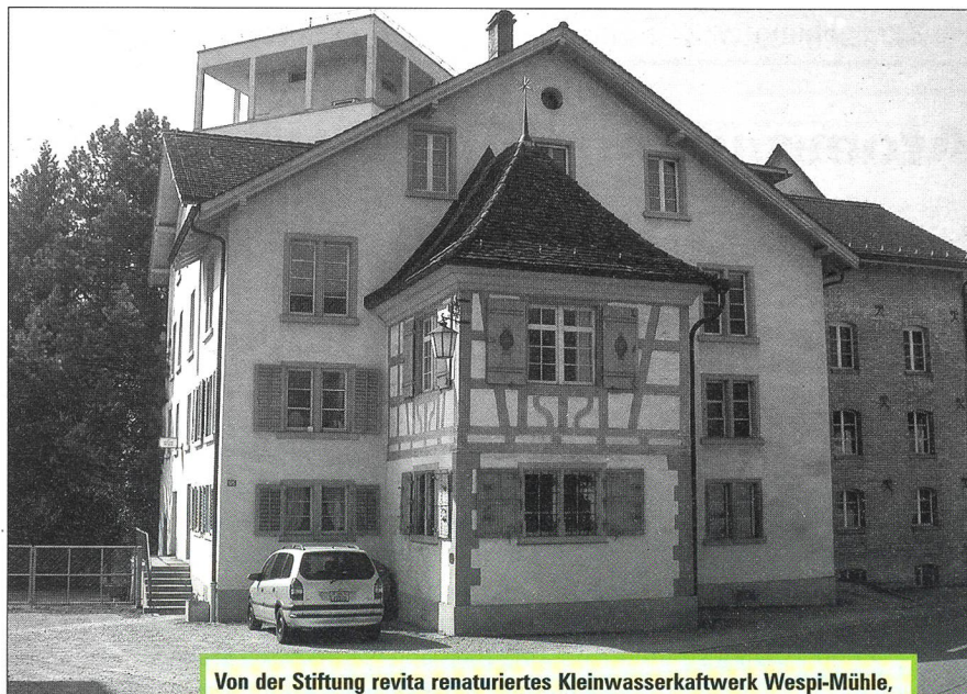
Von der Stiftung revita renaturiertes Kleinwasserkraftwerk Wespi-Mühle, Winterthur, Wülflingen – «Naturmade star!»-zertifiziert.

Turbinierung in den meisten Fällen kein Problem dar. Auf diese Weise kann sekundär gleich noch die Produktion aus erneuerbaren Energien gefördert werden. Energetische Feinanalysen in 10 Wasserversorgungen haben ein Einsparungspotenzial beim Energieverbrauch von 20%–50% ergeben. Besteht die Möglichkeit der Stromproduktion, steigt das Sparpotenzial auf 50%–100%.