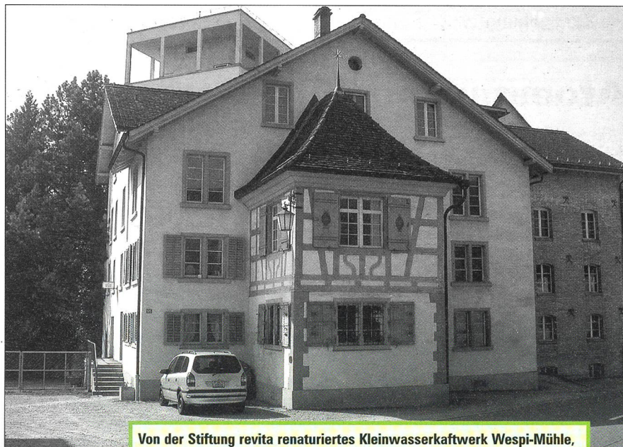
Von der Stiftung revita renaturiertes Kleinwasserkraftwerk Wespi-Mühle, Winterthur, Wülflingen – «Naturmade star!»-zertifiziert.

Turbinierung in den meisten Fällen kein Problem dar. Auf diese Weise kann sekundär gleich noch die Produktion aus erneuerbaren Energien gefördert werden. Energetische Feinanalysen in 10 Wasserversorgungen haben ein Einsparungspotenzial beim Energieverbrauch von 20%–50% ergeben. Besteht die Möglichkeit der Stromproduktion, steigt das Sparpotenzial auf 50%–100%.