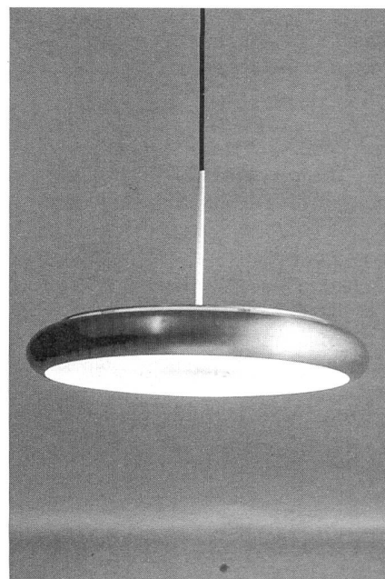
IFO, Stockwerk 3/Frauenfeld, Pendelleuchte, Leuchtstofflampe 55 Watt, Fr. 950.–

Die Schweizerische Agentur für Energieeffizienz (S.A.F.E.) ist vor rund fünf Jahren aus dem Kreis des SES-Stiftungsrates heraus entstanden. Mittlerweile hat S.A.F.E. im Rahmen des Programms EnergieSchweiz einen Leistungsauftrag. Ziel dieses Auftrages ist es, den Elektrizitätsverbrauch im Bereich der elektrischen Geräte und der künstlichen Beleuchtung in den nächsten Jahren zu reduzieren.