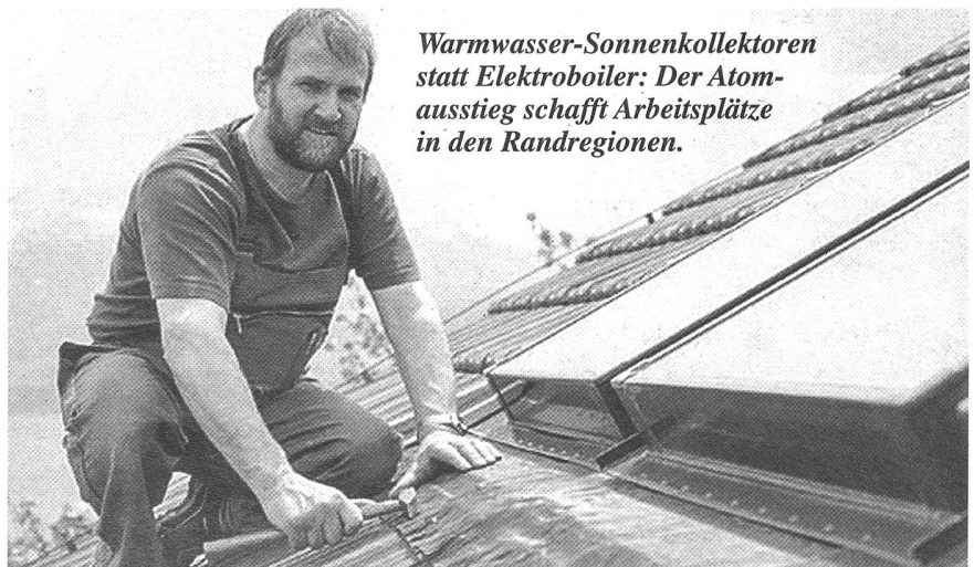
Warmwasser-Sonnenkollektoren statt Elektroboiler: Der Atomausstieg schafft Arbeitsplätze in den Randregionen.

Nach dem Nein der Nidwaldner Bevölkerung zum Atommülllager Wellenberg müssen Konzeptdiskussion und Standortsuche grundsätzlich von neuem beginnen. Per Atomgesetz sollen die Kantone jetzt entmachtet werden: Sie sollen zu einem Atommülllager nichts mehr zu entscheiden haben. So kann die Nagra jederzeit wieder im Alpenraum aufkreuzen. Sie hat es vor Jahren bereits am Piz Pian Grand in Graubünden/Tessin und am Oberbauenstock in Uri versucht. Nur mit einem JA zur Volksinitiative «Strom ohne Atom» haben die Kantone bei der Realisierung von Atommülllagern noch etwas zu entscheiden. Die Initiative sichert das demokratische Mitentscheidungsrecht in der Bundesverfassung. □