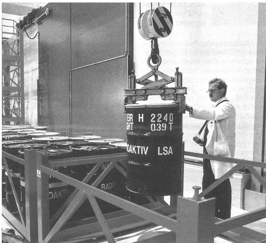
Noch in diesem Jahr werden die ersten Behälter aus La Hague (F) im Zwischenlager in Würenlingen eintreffen.

Die Wiederaufarbeitung entstammt ursprünglich den Atomwaffenprogrammen. Man zerlegte abgebrannte Brennelemente und gewann daraus Plutonium. Später versuchte man die Wiederaufarbeitung als ökologisches Recycling zu propagieren: Man wollte aus den gebrauchten Brennelementen sowohl das Plutonium wie das Uranium gewinnen, um es erneut in Reaktoren einzusetzen. Anfänglich glaubte man, damit eine Art energetisches Perpetuum mobile gefunden zu haben. Die Rechnung ging jedoch nicht auf. Nur ein geringer Teil des «recyclierten» Materials wird wieder verwendet. Doch vermehrt sich durch die Wiederaufarbeitung die Abfallmenge: Aus 1'000 Kilogramm abgebranntem Brennstoff entstehen rund 1'300 Kilogramm mittleradioaktiver und 4'700 Kilogramm schwachradioaktiver Müll.