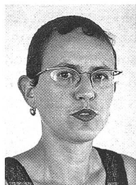
Von Susan Boos, Redaktorin der WoZ

Wiederaufarbeitung bringt böse Überraschungen: Nach neusten Informationen der Umweltorganisation Wise-Paris muss die Schweiz bis zu zehn Mal mehr radioaktiven Müll aus Frankreich zurücknehmen als die Wiederaufbereitungsfirma Cogéma offiziell angibt.