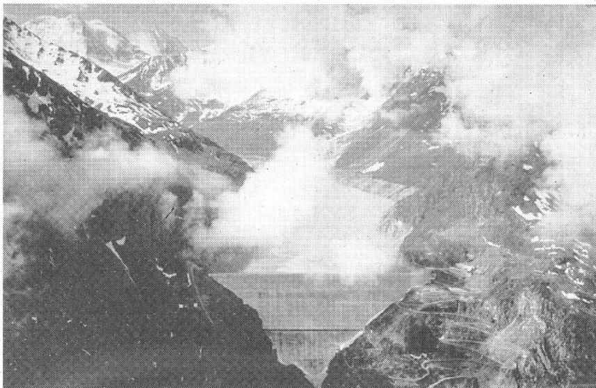
Das Wasserkraftwerk der Grande Dixence ist ein Spitzenkandidat für rückzahlbare Darlehen aus der Förderabgabe.

vom Verteilnetz, das heisst des Marktbereiches vom Monopolbereich. Ohne klare Trennung in ein kompetitives Endkundengeschäft und ein monopolistisches Verteilnetz, welches in öffentlichem Besitz bleibt oder übergeführt wird, sind Marktbehinderungen vorprogrammiert. Einerseits wird es Quersubventionierungen zwischen den beiden Bereichen geben. Schon eine Trennung der Arbeitskräfte der beiden Arbeitsbereiche wird schwierig sein. Beispielsweise die Elektriker, welche die Stromleitungen flicken, können auch für Dienstleistungen im