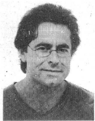
Von Kurt Marti, Redaktor von Energie & Umwelt

Die parlamentarischen Beratungen über das Elektrizitätsmarktgesetz (EMG) beginnen im März. Unter dem Druck der Marktkräfte ist eine gestaffelte Öffnung des Marktes eine Illusion. Mit einem solchen Heimatschutz für die Atomkraftwerke werden ungerechterweise die Haushalte und das Gewerbe zur Kasse gebeten. Jetzt braucht es eine rasche Öffnung für alle Stromkunden, verbunden mit flankierenden Massnahmen.