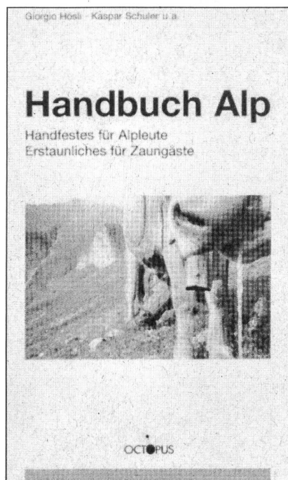
Handbuch Alp Handfestes für Alpleute – Erstaunliches für Zaungäste Giorgio Hösl, Kaspar Schuler u.a. Octopus Verlag 1998; 368 Seiten Preis: 47 Franken

Seit kurzem macht ein aussergewöhnliches Buch still Furore auf dem Schweizer Büchermarkt. Das "Handbuch Alp" ein Nachschlagewerk und Lesebuch für Älplerinnen und Älpler, für Zaungäste und Alp(en)verliebte war in der Erstauflage von 1500 Stück bereits nach einem Monat ausverkauft. Die Zweitaufgabe ist jetzt erhältlich.