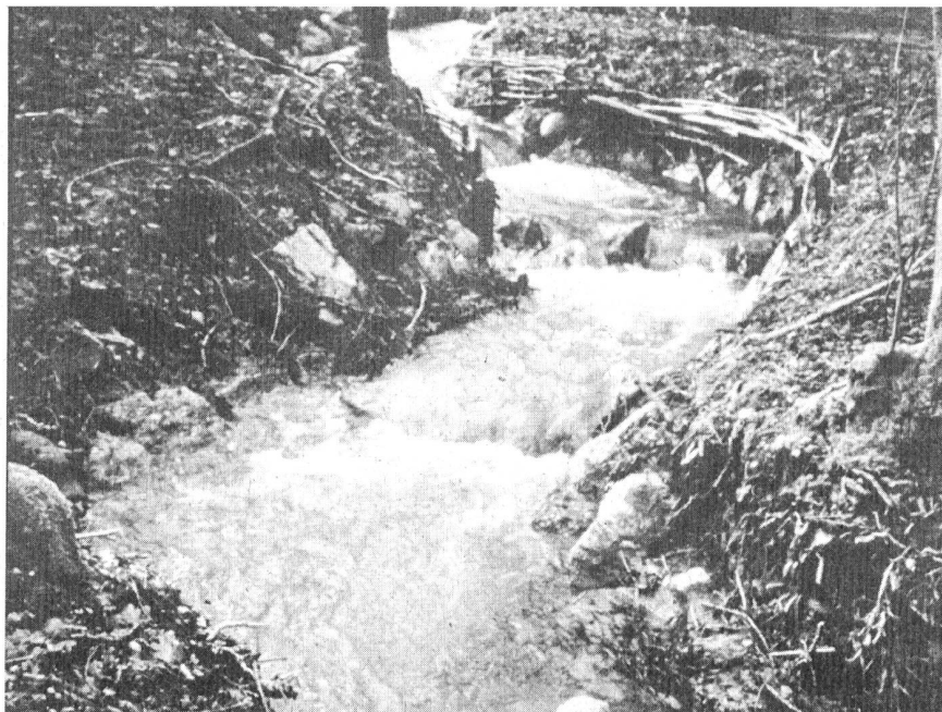
Umgebungsgewässer für den Aufstieg von Fischen und Kleinwassertiere.

Die Idee, das Gefälle der Wasserversorgungen energetisch zu nutzen, ist nicht neu. Schon vor Jahrhundertfrist trieb Energie aus Trinkwasserleitungen in Industrie und Gewerbe Geräte und Maschinen an. Der Schritt zum Einbau von Turbinen brachte manchen Dörfern das erste elektrische Licht. Heute stehen in der Schweiz rund 80 Anlagen in Betrieb. Sie liefern etwa 60 Millionen Kilowattstunden Strom pro Jahr. Dies deckt den Bedarf einer Stadt mit rund 12'500 Haushalten. Die grösste Anlage betreibt das Elektrizitätswerk Buchs mit einem Stromertrag von rund 7 Millionen Kilowattstunden. Eine Studie des Energie 2000-Projekts "DIANE-Klein-Wasserkraftwerke" hat ergeben, dass es in der Schweiz 325 potentielle Standorte mit einer Jahresleistung von weiteren 122 Millionen Kilowattstunden gibt - bei Stromgestehungskosten zwischen 7 und 23 Rappen pro Kilowattstunde. Ein Viertel dieses Potentials entfällt