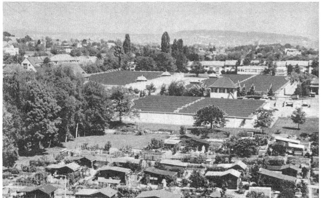
Die Fotomontage zeigt die Solarzellenfelder, die auf den flachen Gebäuden des Seewasserwerkes in Zürich Wollishofen installiert werden sollen.