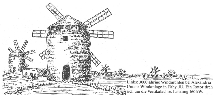
Links: 3000jährige Windmühlen bei Alexandria Unten: Windanlage in Fahy JU. Ein Rotor dreht sich um die Vertikalachse. Leistung 160 kW.

Grosse Forschungslaboratorien wie die SANDIA Corporation in Neu-Mexiko haben in den vergangenen Jahren Pionierarbeit in der Entwicklung neuer Anlage-Typen geleistet. Vor allem gelang der Nachweis, dass Rotoren mit vertikaler Drehachse – Darrieus-Anlagen genannt – wirtschaftlich gebaut und betrieben werden können. So hat sich Kanada nach positiven Betriebserfahrungen mit einem 230-kW-Aggregat entschlossen, einen grossen Megawatt-Darrieus-Rotor mit 4000 Quadratmetern Windfläche zu bauen. Langfristiges Ziel ist die Senkung der Stromkosten auf drei bis vier Cents pro kWh, um gegenüber konventionellen Methoden (Kohle und Erdgas) konkurrenzfähig zu werden.