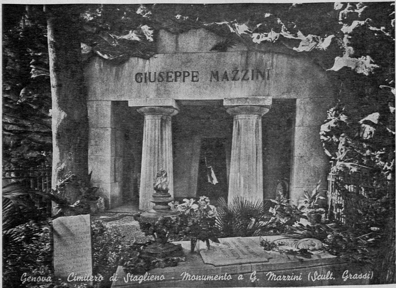
Genova - Cimitero di Staglieno - Monumento a G. Mazzini (Scult. Grassi)

Ad ogni opera vostra, nel cerchio della patria e della famiglia, chiedete a voi stessi: «se questo ch'io fo fosse fatto da tutti e per tutti, gioverebbe o nuocerebbe all'umanità?, e se la coscienza vi rispon-