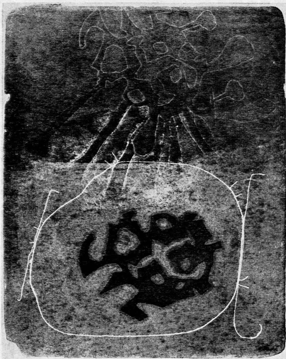
HAROLD TOWN (Canadà)

Campigli incisore non è diverso dal pittore se non in un più tenue accordo cro-