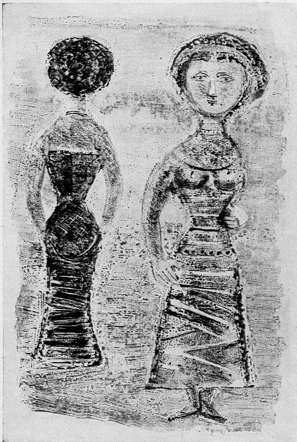
MASSIMO CAMPIGLI (Italia)