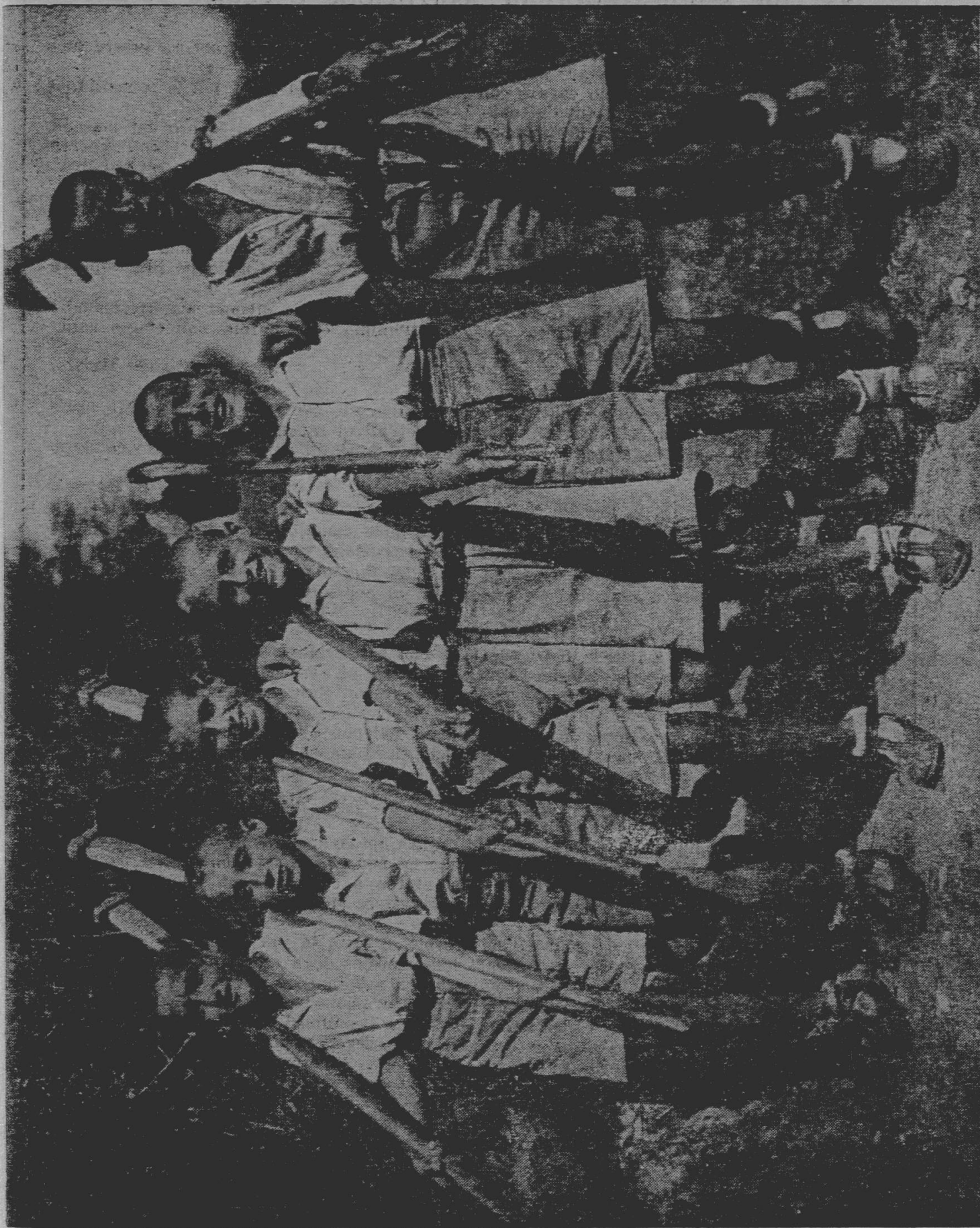
Mani, cuore, testa. — Non vedere che gli sport, il cinema e la radio significa tradire la gioventù e la terra dei padri.