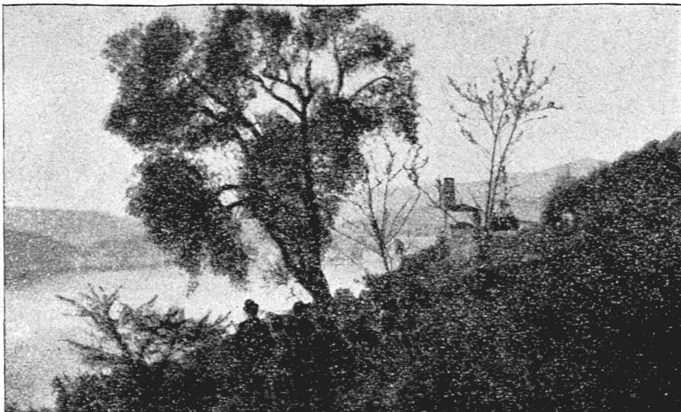
SCUOLE COMUNALI DI LUGANO — Lezioni all'aperto: L'ulivo (Castagnola)

Così il Charnuis. Facciamo tesoro de' suoi consigli. Morte alle chiacchiere.