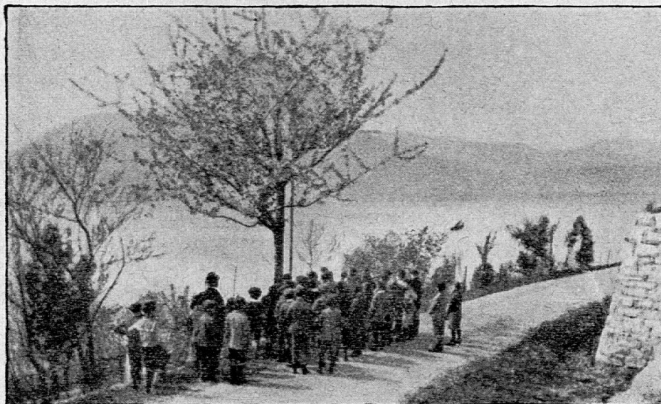
SCUOLE COMUNALI DI LUGANO — Lezioni all'aperto: Ciliegio in fiore.

(3) Mario Borsa — « La cascina sul Po » — Casa Risorgimento R. Caddeo, Milano — 1920 — lire 6.