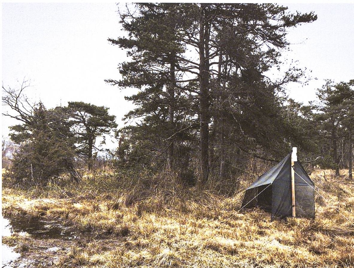
Fig. 2. Milieu autour de la tente Malaise dans laquelle Athripsodes leucophaeus a été capturé.

L'écologie d' A. leucophaeus est encore relativement peu documentée. En France, on retrouve A. leucophaeus en abondance dans des grands cours d'eau tels que l'Aisne, le Doubs, la Loire, la Marne, la Meuse, la Seine amont, le Rhône, le Tarn et la Vienne (Opie-Benthos 2024, G. Coppa non publié). Les rares observations d' A. leucophaeus aux abords du Léman, du lac de Zurich et du lac de Lugano ont été réalisées avant que leurs eaux n'entrent dans leur phase d'eutrophisation dans la deuxième moitié du XX e siècle. Sa présence dans les cours d'eau mais aussi aux abords de lacs suggère que l'espèce n'est peut-être pas exclusivement liée aux milieux fluviaux. Toutefois, il est à considérer avec prudence que l'individu d' A. leucophaeus capturé dans la réserve naturelle de la Grande Cariçaie puisse avoir accompli sa phase larvaire dans la zone alluviale (par ex. dans des plans d'eau stagnants de la ceinture marécageuse) ou dans la zone littorale du lac de Neuchâtel.