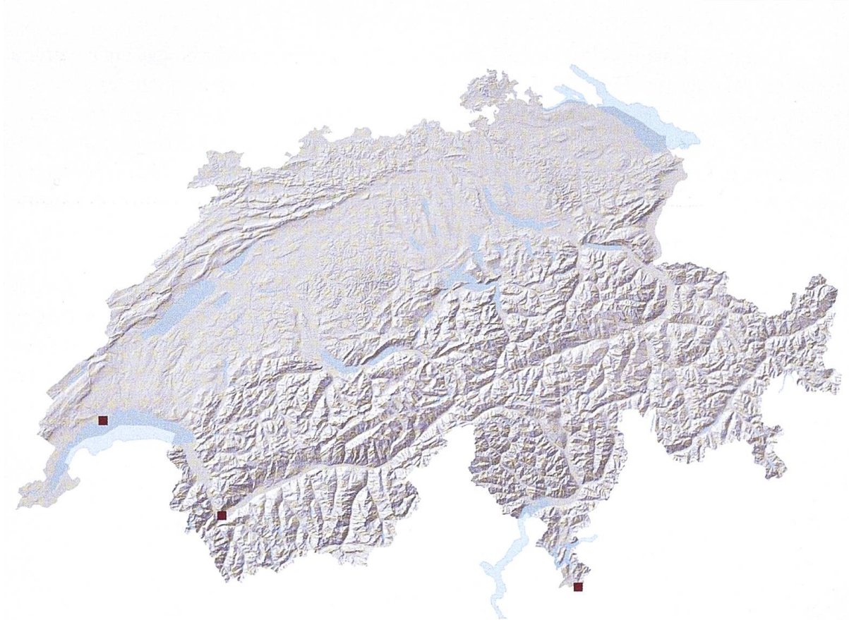
Fig. 2. Distribution d' Anidorus sanguinolentus en Suisse (carrés rouges : présence après l'an 2000). Carte © info fauna, swisstopo.