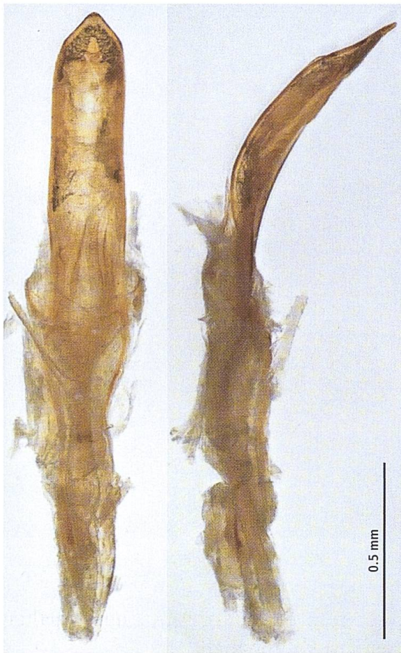
Abb. 3. Penis von Polydrusus abeillei abeillei , ventrale und laterale Sicht.

( P. amoenus : Beine dunkel, schwärzlich). Pronotum breiter, Mittellinie leicht erhoben und unbeschuppt ( P. amoenus : Pronotum schmaler, Mittellinie schwach oder nicht sichtbar). Fühler heller, gelblich, auffälliger Geschlechtsdimorphismus: beim Männchen Scapus und Geisselglieder verbreitert ( P. amoenus : Fühler dunkel, schwärzlich bis rötlich, nicht modifiziert). Penis parallelseitig, Spitze breitwinklig ( P. amoenus : Penis seitlich gerundet, Spitze schmaler, spitzwinklig).