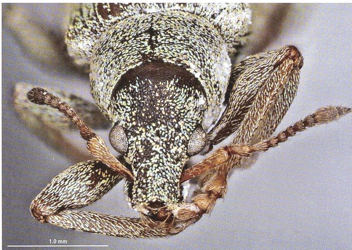
Abb. 2. Frontalsicht auf den Kopf von Polydrusus abeillei abeillei , gut zu erkennen ist der verdickte Scapus der Fühler, die breiten Fühlergeißelglieder und die leicht erhobene Mittellinie des Pronotums, Männchen Trient, coll. N. Cerutti.