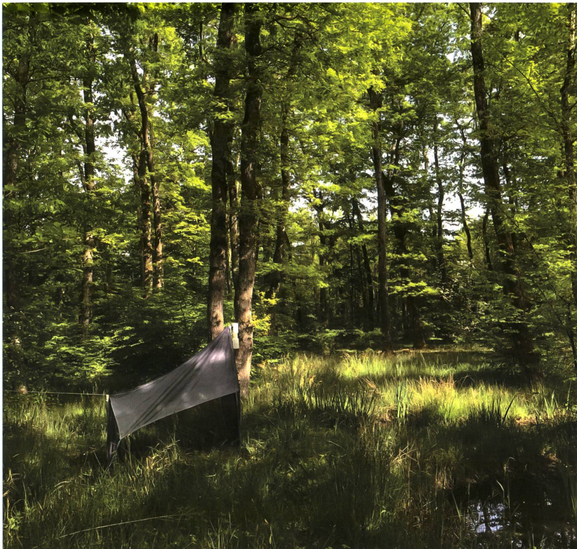
Fig. 1. Piège Malaise situé dans la chênaie à molinie de la réserve naturelle du Bois des Mouilles dans lequel les femelles de Sargus harderseni Mason & Rozkošný, 2008 ont été collectées en juin 2022.

Les deux femelles ont été collectées dans un piège Malaise situé dans la réserve naturelle du Bois des Mouilles (Bernex, canton de Genève, Fig. 1) au mois de juin 2022. Cette réserve est constituée d'un grand plan d'eau colonisé par une roselière, entouré de prairies et d'une chênaie à molinie.