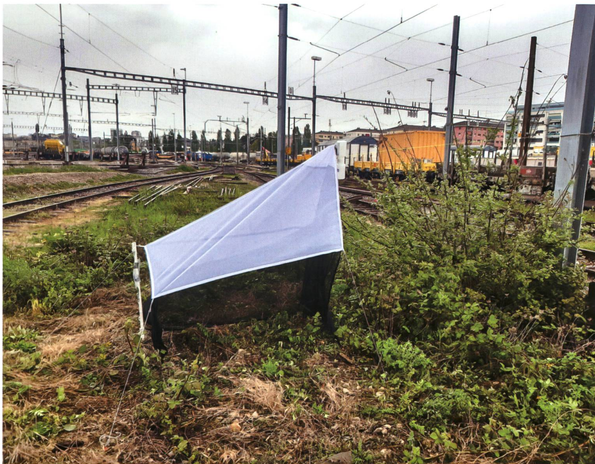
Fig. 1. Piège Malaise situé dans la gare de triage de Renens (VD) dans lequel un mâle d' Eumerus consimilis a été collecté.

Statut dans la liste rouge européenne (Vujić et al. 2022) : préoccupation mineure (LC).