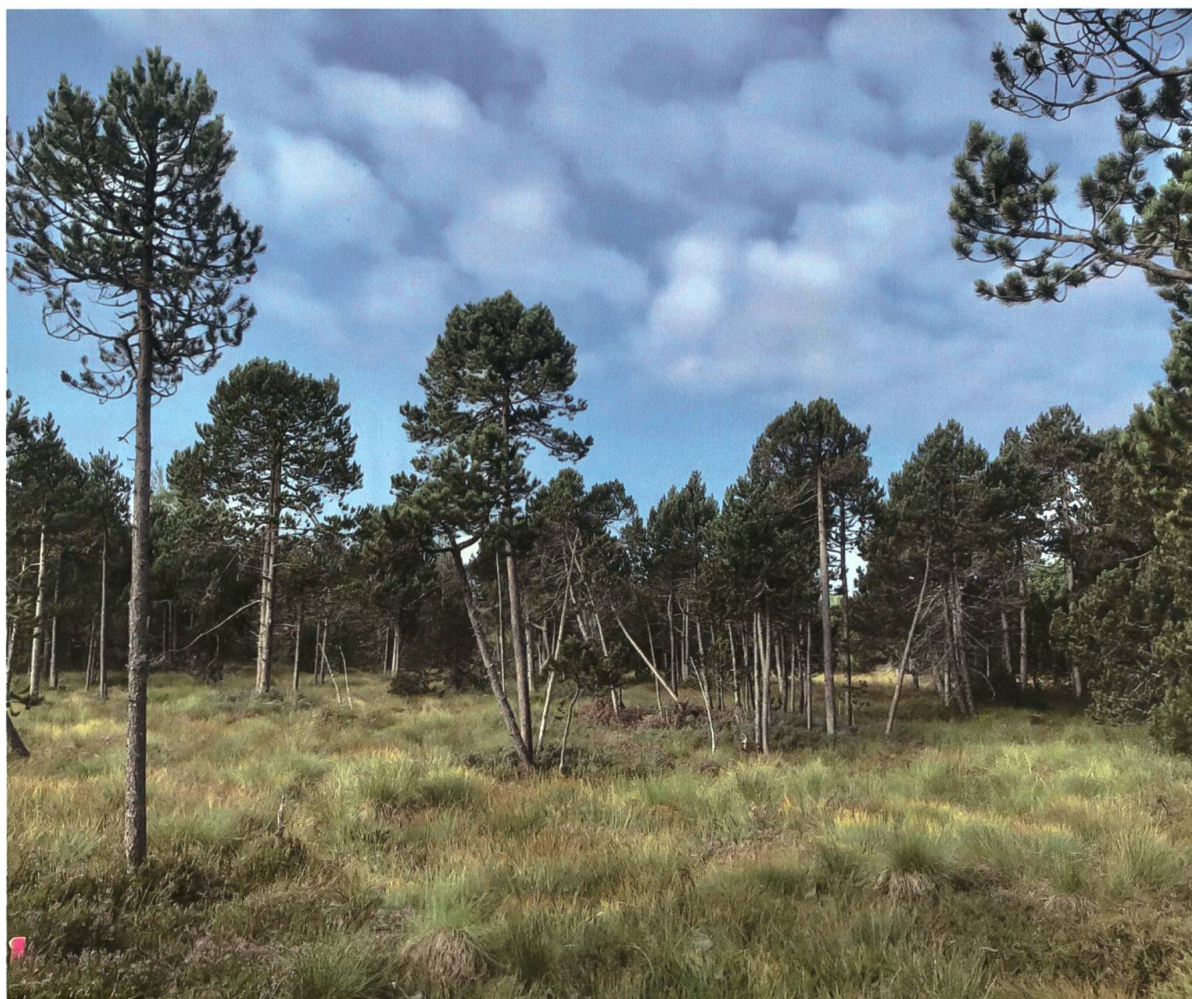
Fig. 3. Tourbière du Cachot (NE), 2021, proche de l'emplacement historique du piège Malaise où a été collecté Xylota caeruleiventris en 1973.

telles que X. florum (Fabricius, 1805). Son identification repose sur des critères subtils concernant notamment la forme du deuxième tergite et de ses macules ainsi que de la pilosité du fémur arrière et de l'extrémité de l'abdomen (Speight & Sarthou 2017).