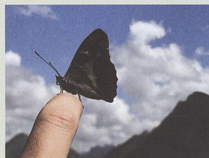
Concurrence entre Brenlaire, Folliéran et papillon, dans la vallée du Motélon, 25 juillet 2020.