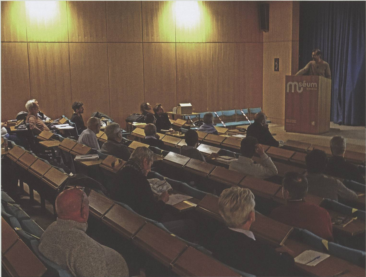
Réunion des Entomologistes Rhône-Alpins (RERA) au Muséum de Genève le 10 octobre 2020.