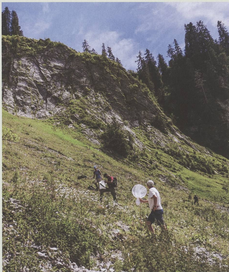
A la recherche des papillons dans la région du Jaun le 4 juillet 2020.