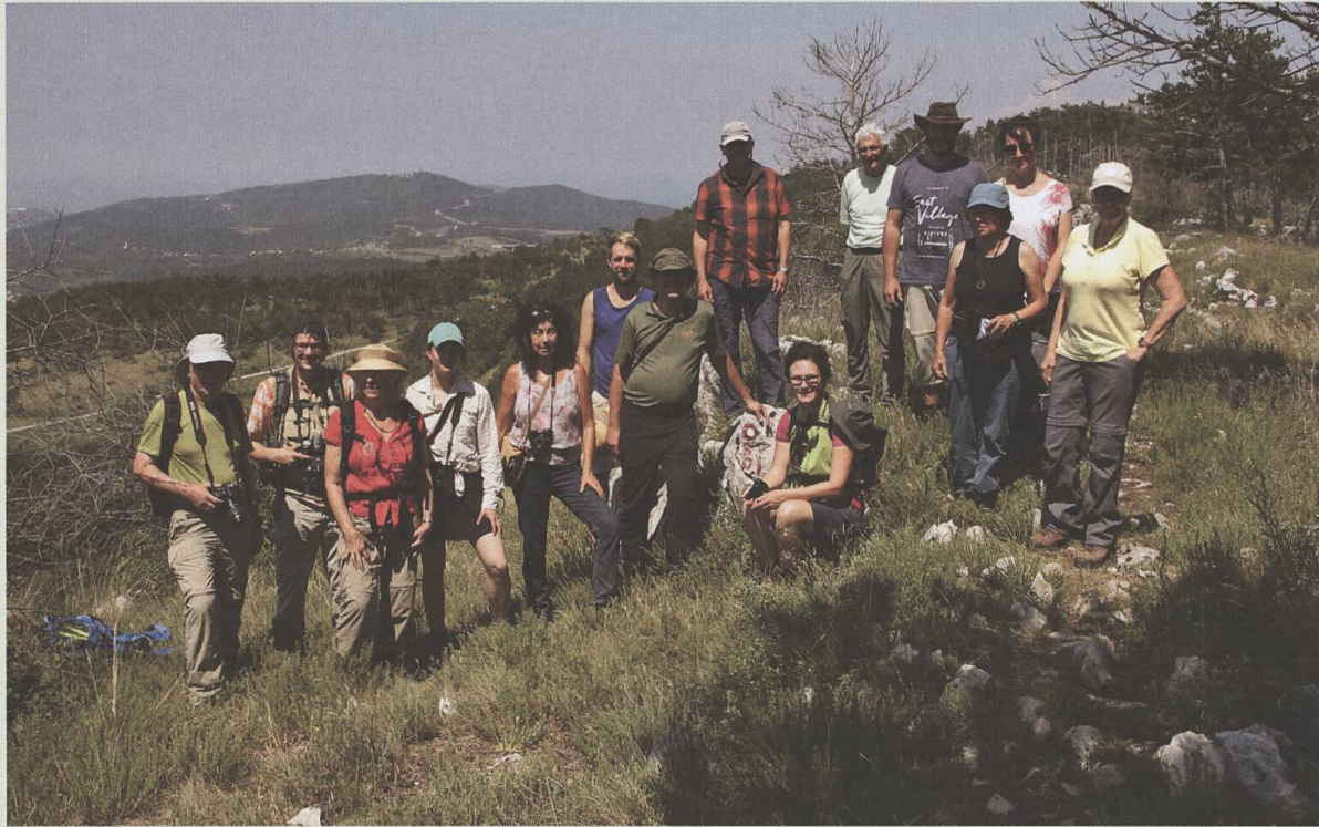
Abb. 2. Gruppenbild der Slowenien-Exkursion am Karstrand (Kraški rob) bei Praproče, am 22.07.2020.