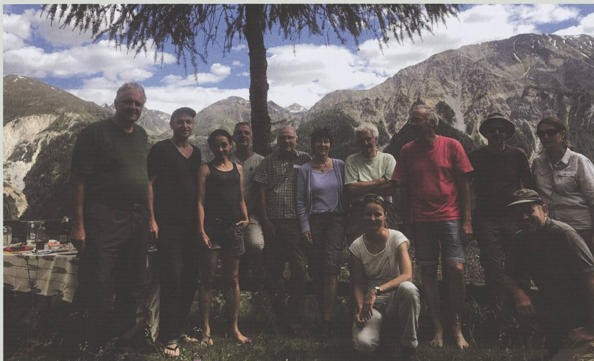
Abb. 1. Gruppenbild in Sta. Maria Val Müstair (CH), am Schluss der EGZ-Exkursion ins Vinschgau (I), am 5.07.2020.