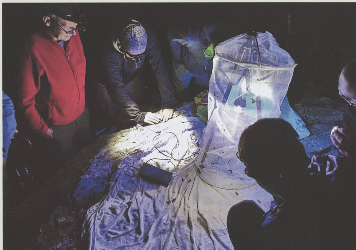
Piégeage nocturne dans le vallon des Morthéys en août 2020.