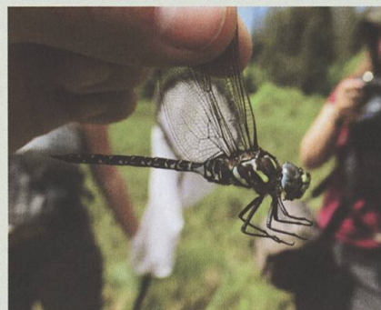
Grande découverte dans la région de la Berra le 27 juin 2020 : Aeshna subarctica .