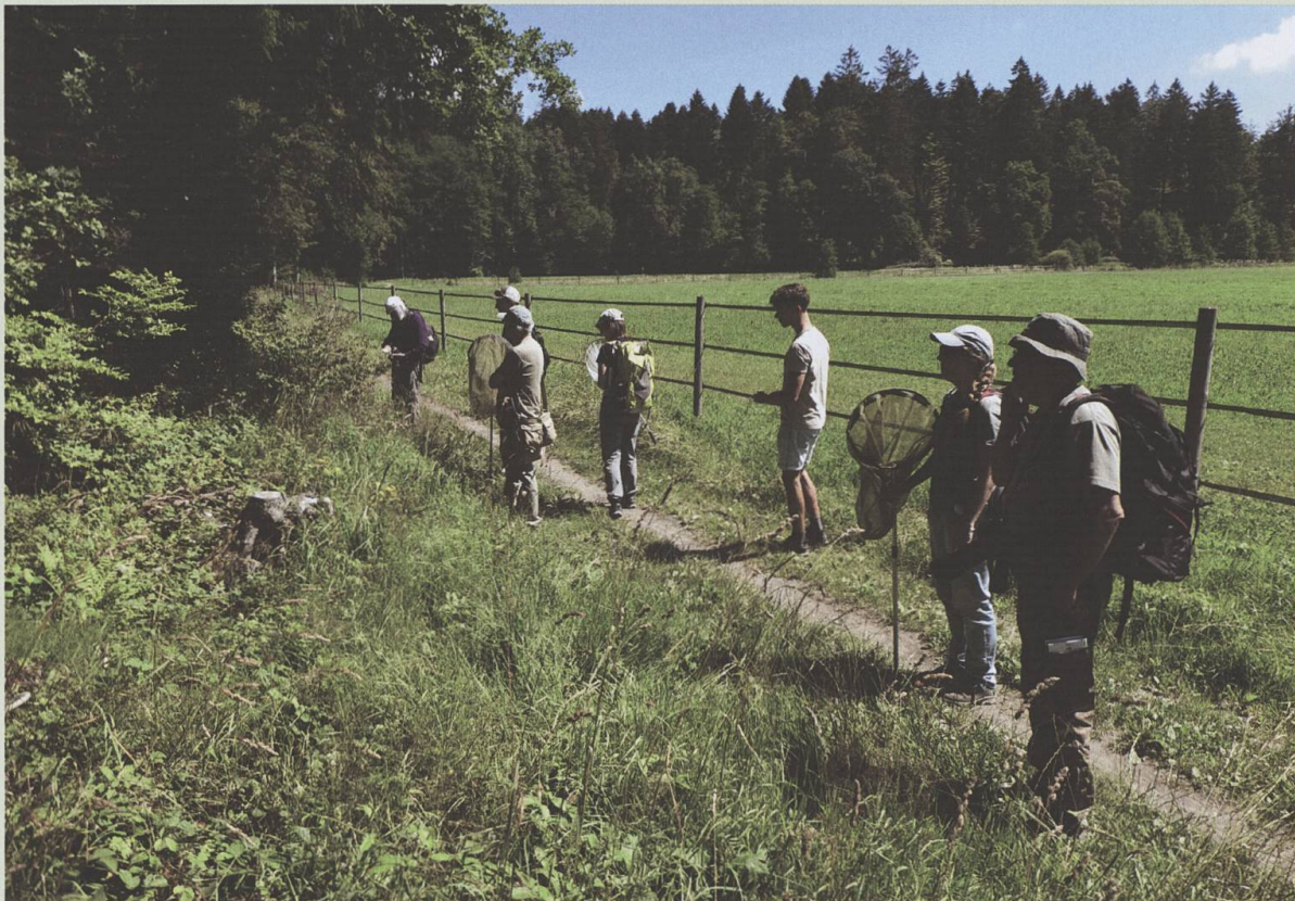
Une lisière ensoleillée et des entomologistes armés de filets : la chasse aux syrphes est lancée.

contributeurs efficaces, récoltant environ un sixième des 6885 échantillons de fourmis, avec une soixantaine d'espèces différentes ! Le projet de poursuivre l'inventaire des fourmis à travers le canton avec les personnes intéressées et de proposer des ateliers de détermination a été mis en veille en 2020 mais sera relancé en 2021.