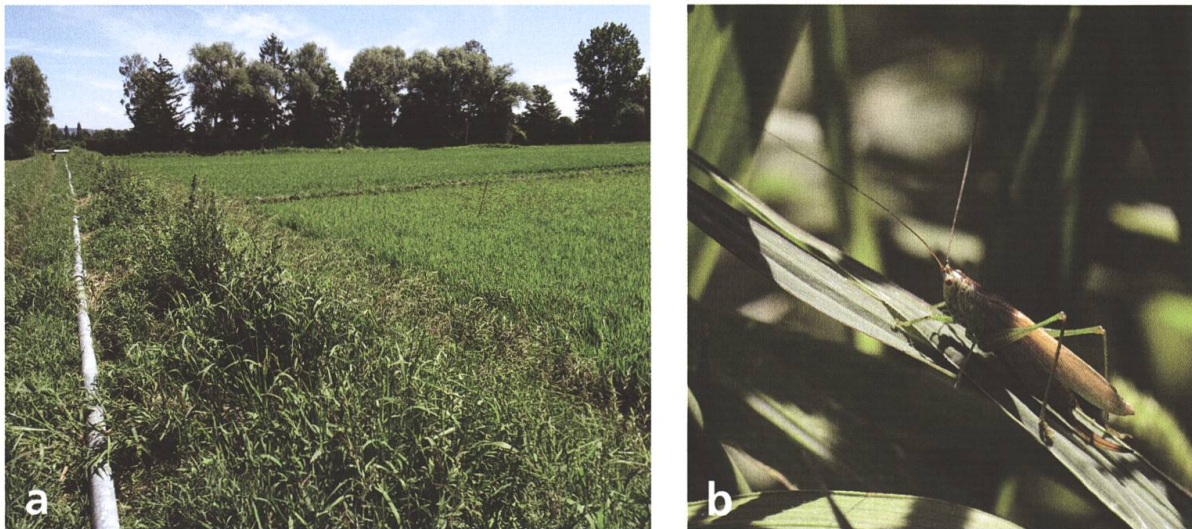
Fig. 1 a) Végétation de la digue en bordure des champs de riz à Mont-Vully (FR), 431 m, juillet 2020. b) Femelle adulte macroptère de Conocephalus dorsalis forme burri , Mont-Vully (FR), juillet 2020.

notamment dans le contexte du réchauffement climatique (Gardiner 2009, Hochkirch & Damerau 2009, Poniatowski et al. 2012). La dispersion d'individus macroptères a été avancée pour expliquer la colonisation par le Conocéphale des roseaux Conocephalus dorsalis (Latreille, 1804) d'une nouvelle localité sur le relief jurassien à 1000 m d'altitude, éloignée de 15 à 25 km des prochains sites connus (Monnerat 2020). Nous documentons ici les premières observations de la forme macroptère de C. dorsalis en Suisse.