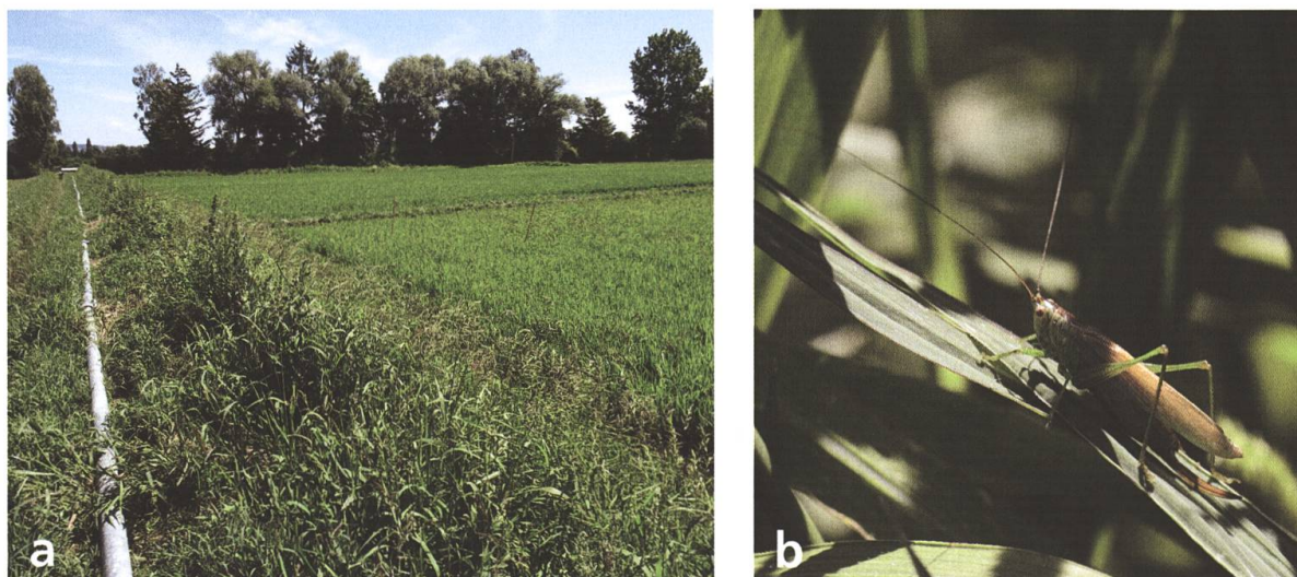
Fig. 1 a) Végétation de la digue en bordure des champs de riz à Mont-Vully (FR), 431 m, juillet 2020. b) Femelle adulte macroptère de Conocephalus dorsalis forme burri , Mont-Vully (FR), juillet 2020.

notamment dans le contexte du réchauffement climatique (Gardiner 2009, Hochkirch & Damerau 2009, Poniatowski et al. 2012). La dispersion d'individus macroptères a été avancée pour expliquer la colonisation par le Conocéphale des roseaux Conocephalus dorsalis (Latreille, 1804) d'une nouvelle localité sur le relief jurassien à 1000 m d'altitude, éloignée de 15 à 25 km des prochains sites connus (Monnerat 2020). Nous documentons ici les premières observations de la forme macroptère de C. dorsalis en Suisse.