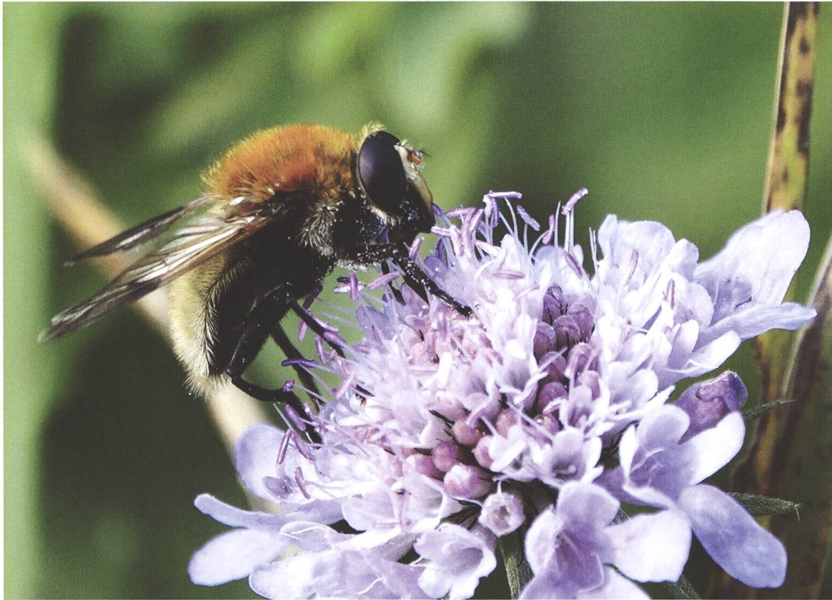
Fig. 4. Sericomyia superbiens (Müller, 1776), sur une scabieuse ( Scabiosa sp.) le 12 octobre 2020 au Marais de Pré-Bordon dans la commune de Gy.

éléments d'écologie. Sericomyia superbiens est probablement répandue dans d'autres zones humides du canton de Genève où des relevés tardifs devraient être réalisés pour détecter sa présence.