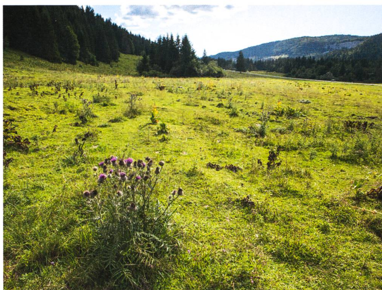
Fig. 1. Petite population de Cirsium eriophorum dans un pâturage du Brassus où Bombus distinguendus a été observé.