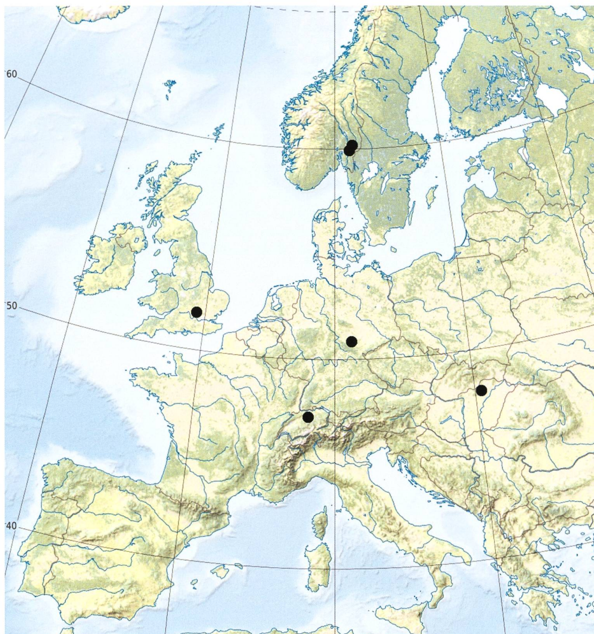
Fig. 2. Distribution connue de Rhexoza richardsi en Europe (fond de carte Natural Earth).

(Tonnoir 1927). Les autres espèces de Rhexoza pourraient occuper des niches écologiques similaires.