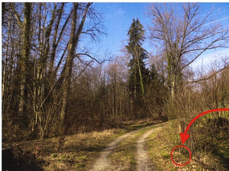
Fig. 2. Site de collecte des deux spécimens de T. rotundipennis à Bretigny-sur-Morrens (VD). La flèche et le cercle rouge indiquent l'emplacement exact.

Suite à ces nouvelles observations, les collections du Muséum d'histoire naturelle de Genève (MHNG) et du MZL ont été consultées par les auteurs afin de déceler l'éventuelle présence de T. rotundipennis parmi les spécimens identifiés comme T. bicolor . Ce