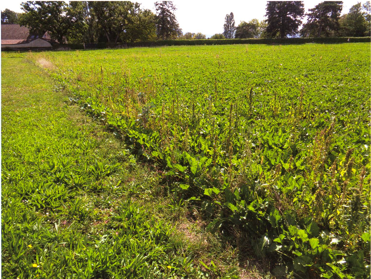
Fig. 1. Prangins (VD), bordure de la culture de betterave sucrière où l'observation de Lixus juncii a été réalisée en 2019.

dans la liste commentée de Germann (2010), sans information supplémentaire. Après consultation des collections muséales de Suisse (lors de la préparation de la liste commentée de Germann (2010)) et des cahiers inédits de Pierre Scherler (qui avait relevé jusqu'en 2001 les données de Curculionoidea de presque toutes les collections suisses; une copie étant conservée au Naturhistorisches Museum Bern), il s'avère que seul un exemplaire ancien existe en collection: 1 ex., Mendrisio (TI), 16.10.[19]29, coll. V. Allenspach (Naturhistorisches Museum Basel).