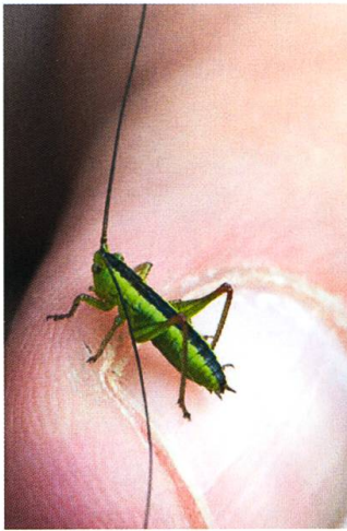
Fig. 2. Nympe mâle de Conocephalus dorsalis , Bois des Lattes (NE), septembre 2018.