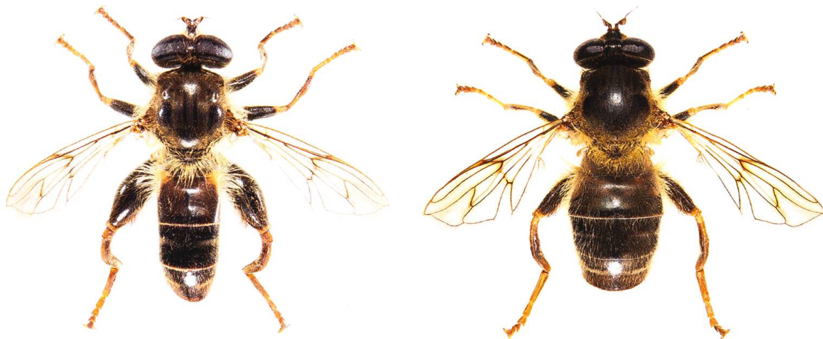
Fig. 2. Criorhina pachymera , habitus du mâle (à gauche) et de la femelle (à droite), taille 12–18,5 mm.

cate à cause d'une confusion possible avec une forme particulière de Criorhina ranunculi (Panzer, 1804) qui vient d'être découverte en Suisse (Speight et al. 2020). Les principaux ouvrages de détermination ne prenant pas en compte cette forme rare de C. ranunculi , une clé a été élaborée par Speight et al. (2020). L'observation de C. pachymera dans deux localités composées de forêts riveraines mixtes, classées comme zones alluviales d'importance nationale depuis 1992, témoigne de la nécessité de préserver ces habitats pour la conservation d'espèces menacées.