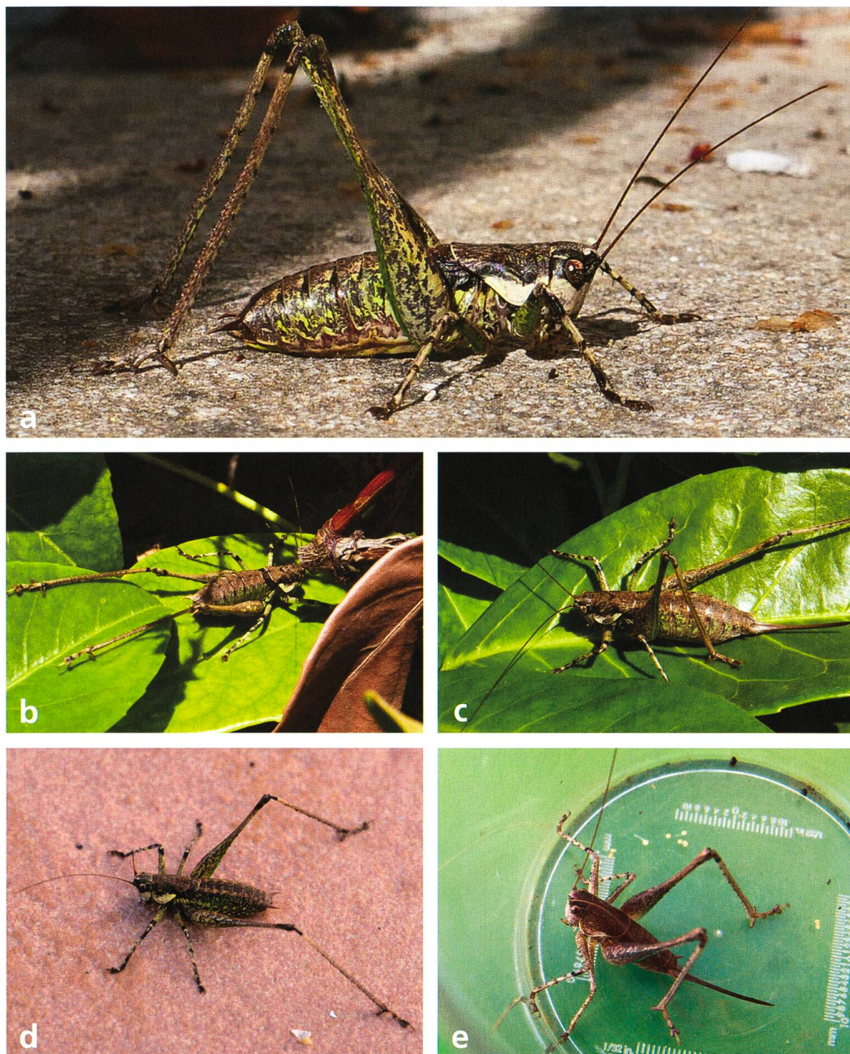
Fig. 1. Rhacocleis annulata Fieber, 1853. a) R. annulata , mâle adulte, Anières (GE), août 2018. b) R. annulata , mâle adulte, Anières (GE), août 2019. c) R. annulata , femelle adulte, Anières (GE), septembre 2019. d) R. annulata , mâle adulte trouvé à Hauterive (NE), septembre 2019. e) R. annulata , femelle, larve de dernier stade, Lathuile (Haute-Savoie), août 2019.