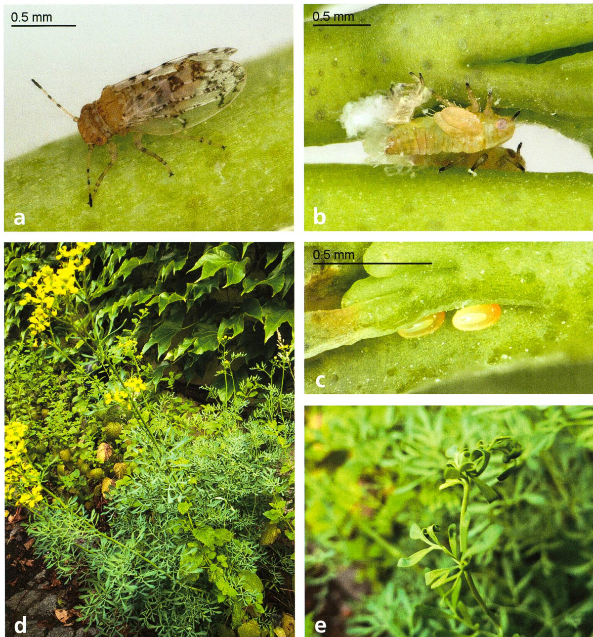
Abb. 1. Agonosцена succincta (Heeger, 1856) und ihre Wirtspflanze: a) Männchen; b) Larven und Exuvie mit Wachausscheidungen; c) Eier; d) Wein-Raute; e) Kräuselung der Blätter.

Gómez 1960), Israel (Bodenheimer 1937, Spodek et al. 2017) und Slowenien (Seljak 2006) sowie als Einschleppung aus Brasilien (Staaten Minas Gerais, Rio de Janeiro, São Paulo) (Costa Lima 1942, Burckhardt & Queiroz 2012) gemeldet. Ältere Angaben aus anderen Ländern betreffen andere, morphologisch ähnliche Arten (Hodkinson & Hollis 1981, Burckhardt & Lauterer 2003). Hier melden wir die Art zum ersten Mal aus der Schweiz und Frankreich.