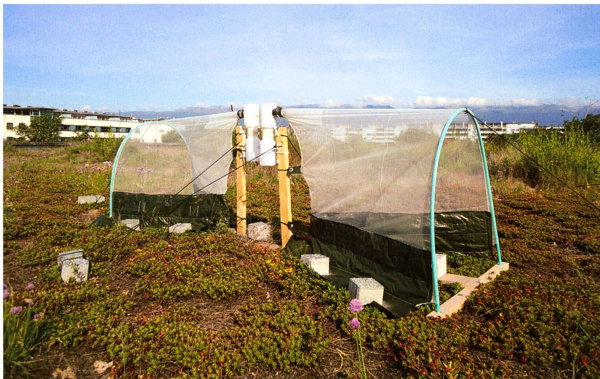
Fig. 1. Deux pièges cornet, disposés tête bêche, sur une toiture végétalisée.

Les pièges cornet présentés ici ont été utilisés dans le cadre d'une étude visant à évaluer la diversité des pollinisateurs passant et émergeant sur un ensemble de six toitures végétalisées extensives dans le canton de Genève, de mars à août 2017 (Passaseo 2018). L'échantillonnage s'est focalisé sur la capture d'abeilles sauvages (Hymenoptera: Anthophila) et de syrphes (Diptera). Deux pièges (Fig. 1) ont été placés sur chaque toiture végétalisée.