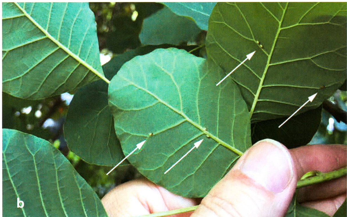
Abb. 1. Perückensträucher mit Calophya rhois : a ) gepflanzte Perückensträucher mit ihren charakteristischen Früchten; b ) Blätter mit adulten Blattflöhe (weisse Pfeile).