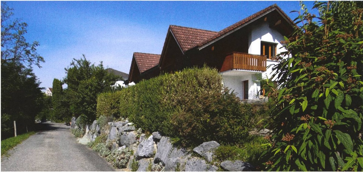
Abb. 2. Rand des Hausgartens Caspär 5 in Jenins (GR), aufgenommen am 3.9.2016, in welchem das ♀ von Rhynchium oculatum oculatum (Fabricius, 1781) aus Abb. 3 am 20.8.2016 entdeckt wurde. Auf der Bruchsteinmauer wächst eine Buchsbaumhecke ( Buxus sempervirens L.) mit Frassschäden durch Raupen des Buchsbaumzünslers ( Cydalima perspectalis).