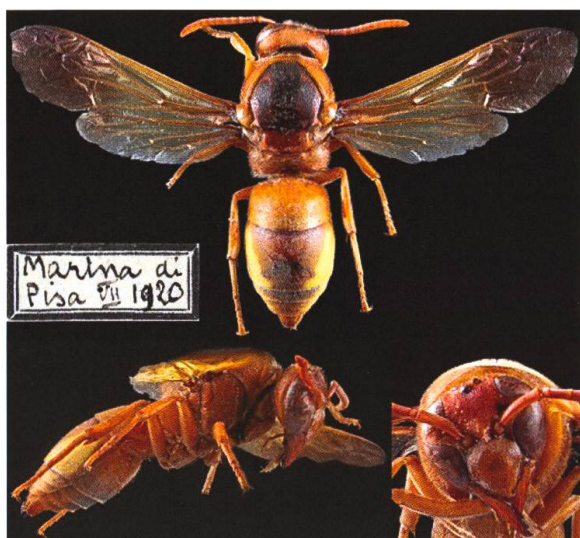
Abb. 1. Präpariertes ♀ (I, Toscana, Marina di Pisa; Juli 1920, A. Nadig leg.; ETHZ coll.) von Rhynchium oculatum oculatum (Fabricius, 1781).

Die zu den Faltenwespen (Vespidae) gehörende Unterfamilie der Lehmwespen (Eumeninae) umfasst weltweit über 3000 solitäre Arten. In Europa sind es 226 Arten in 37 Gattungen (Fauna Europaea 2017), in der Schweiz 75 Arten in 21 Gattungen (Neumeyer 2014). Alle ausser Discoelius verwenden als Baumaterial für ihre Nester einen lehmartigen Mörtel aus mineralischem Bodenmaterial, Wasser und Drüsensekreten.