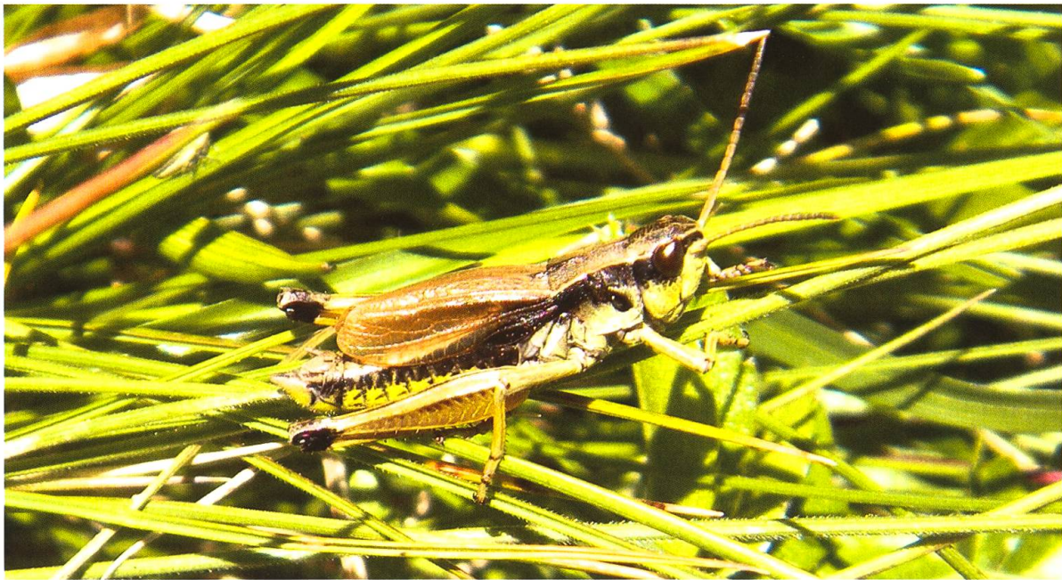
Fig. 1. Le premier mâle de Podismopsis sp. observé à Planplatten, Hasliberg BE, le 13.08.2016.