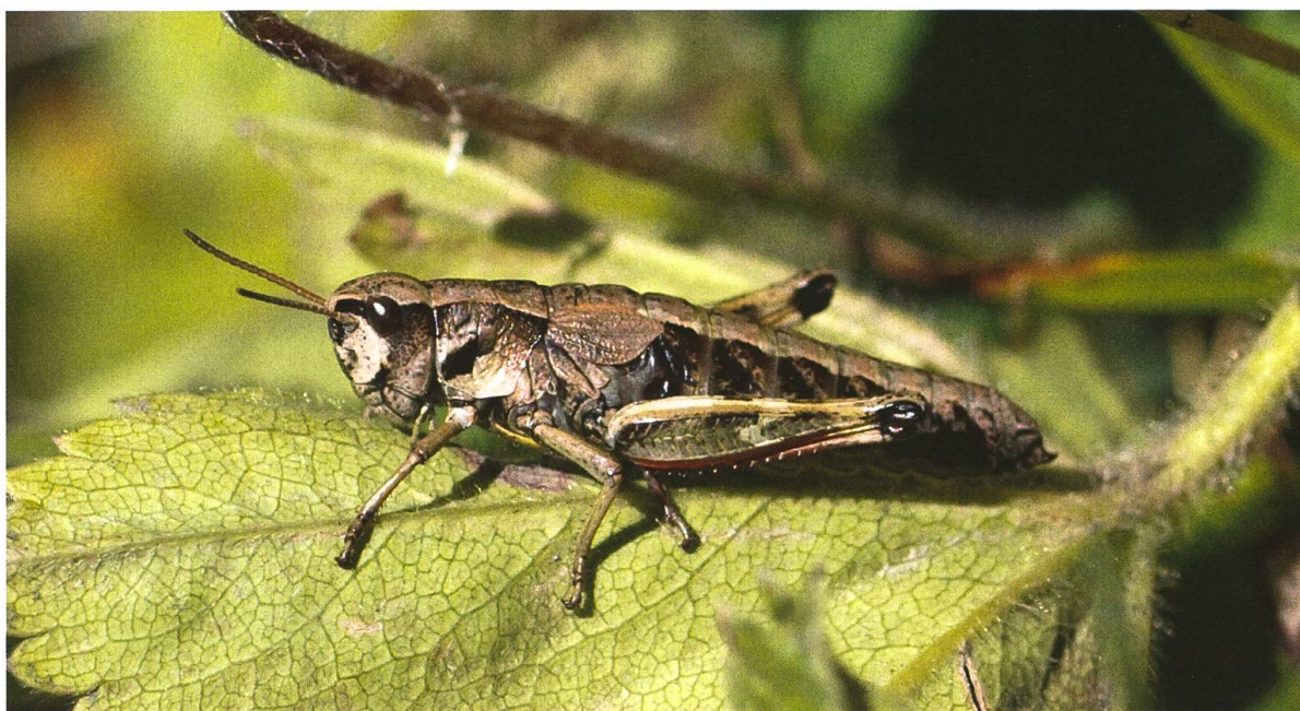
Fig. 2. Femelle de Podismopsis sp. observée à Planplatten – Gummenhubel, Hasliberg (BE), le 14.09.2016.