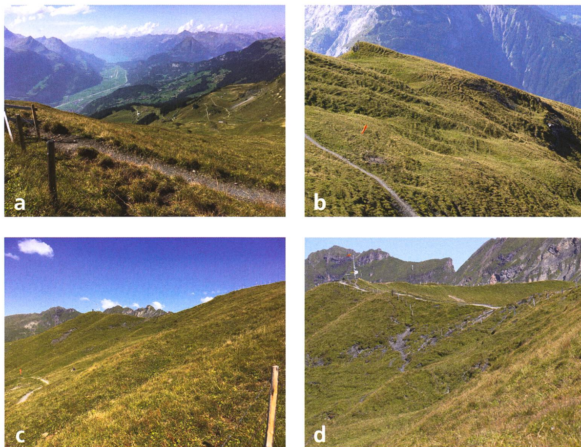
Fig. 4. Vues sur le milieu (principalement Nardion pâturé) dans lequel la population de près de 100 individus de Podismopsis sp. a été observée les 14 et 15.09.2016 le long de la crête sommitale entre Planplatten et Gummenhubel (2170–2240 m) à Hasliberg. a : vue à l'ouest sur le Lac de Brienz, b : vue au sud-ouest; c, d : vue au nord en direction de l'Alpen Tower. Les pylônes avec le drapeau orange correspondent à l'espace de décollage des parapentistes.

l'Oberland bernois. Cette observation effectuée à plus de 100 km à vol d'oiseau de la population de Podismopsis la plus proche, dans les Churfisten, a incité à entreprendre une inspection approfondie du site pour rechercher d'éventuels autres individus.