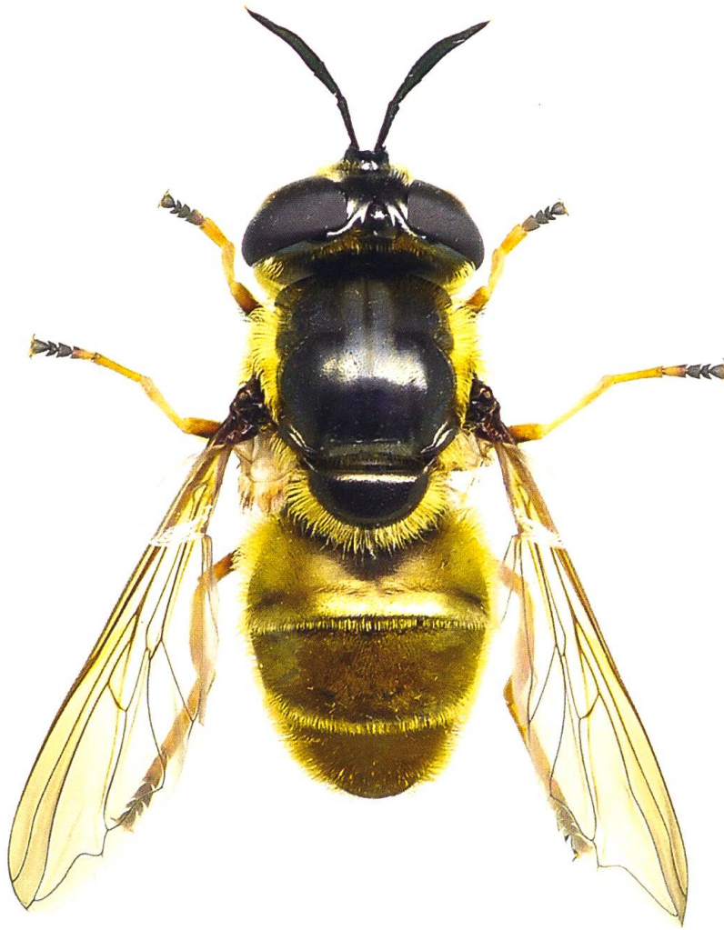
Fig. 1. Habitus de la femelle de Callicera aurata . Les deux bandes de pruinosité blanches qui s'arrêtent au milieu du thorax et les tarses 2–4 noircis sont bien visibles et sont typiques de cette espèce.

C. aurata est généralement associée à la présence d'arbres âgés ou sénescents disposant de cavités remplies d'eau et de débris en putréfaction où la larve se développe lentement (> 1 an) en se nourrissant de micro-organismes (Rotheray 1991). La larve a déjà été extraite de cavités présentes sur les essences suivantes: Fagus (Rotheray 1991, Dussaix 2005), Quercus (Dussaix 2005), Fraxinus (Ricarte 2008) et Betula (Perry 1997). Dès la fin du mois de mai, les adultes volent au-dessus de la canopée et descendent occasionnellement pour se nourrir sur des fleurs ou pour s'abreuver à proximité d'un ruisseau (Speight 2015). Les femelles, moins sédentaires que les mâles, peuvent être trouvées à une grande distance (quelques centaines de mètres) de la forêt, elles ont déjà été observées sur les genres ou les espèces de plantes suivantes: Crataegus , Calluna , Dipsacus fullonum , Filipendula , Hedera helix , Rosa , Hypericum , Rubus fruticosus , Succisa pratensis et Verbascum (Speight 2015).