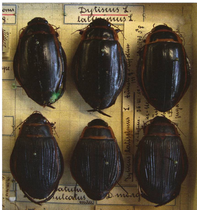
Abb. 1. Exemplare von Dytiscus latissimus Linnaeus, 1758 aus dem Naturhistorischen Museum Basel. (Sammlung Allenspach)

Basierend auf den historischen Fundorten wurden für die Felduntersuchungen verschiedene Gewässer im Kanton Zürich ausgewählt (Abb. 2).