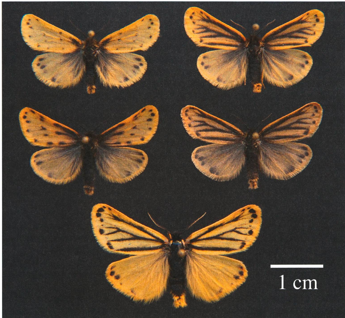
Abb. 3. Setina roscida und sympatrische S. aurita von Avers (GR), um 2500 m ü. M.; 16.7.2009. Oben links: S. roscida, gepunktete Form, darunter Übergangsform. Oben und Mitte rechts: S. roscida, gestreifte Form. Unten Mitte: S. aurita.