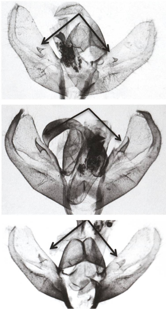
Abb. 4. Männliches Genital, Valven (alle Bilder gleicher Massstab). Oben: aus einer gepunkteten Population von Setina roscida (Ofenpass (GR), 2550 mü.M.; 4.8.2009). Mitte: aus einer gestreiften Population von Setina aurita (Brigels (GR), 2480 mü.M.; 18.9.1980). Unten: eine gestreifte S. roscida (Avers (GR), 2530 mü.M.; 6.7.2015).

(1991) zwei Exemplare von S. roscida ab, die voll gestreifte Vorderflügel zeigen. Alle diese genannten Tiere werden aber als sehr selten auftretende Einzelfälle von Hybridisierung zwischen S. aurita und S. roscida aufgefasst.