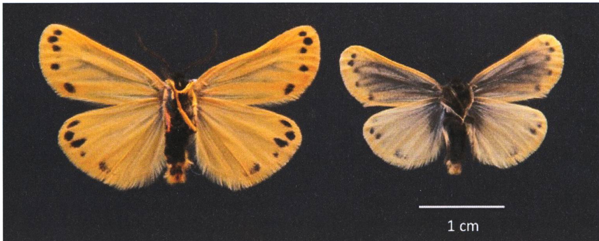
Abb. 5. Unterseiten von Setina aurita , gestreifte Form, links (Maienfeld (GR), 1900 m ü. M; 1.8.2009) und Setina roscida , gestreifte Form, rechts (Avers (GR), 2530 m ü. M; 4.7.2015).

Dieser ist bei S. roscida stark reduziert, manchmal nur ein gerundeter Spross. Bei S. aurita hingegen ist dieser Dorn gross, leicht gebogen und mit scharfer Spitze. Das Genital der gestreiften S. roscida zeigt in Bezug auf dieses Merkmal folgende Charakteristika: der Digitus ist etwas grösser als bei S. roscida aus gepunkteten Populationen, hingegen immer noch deutlich kleiner als bei S. aurita .