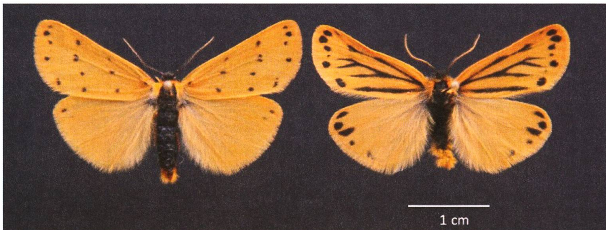
Abb. 2. Setina aurita. Gepunktete Tieflandform (Rothenbrunnen (GR), 660 m ü. M; 10.9.2004) und gestreifte Höhenform (Maienfeld (GR), 1900 m ü. M; 1.8.2009).