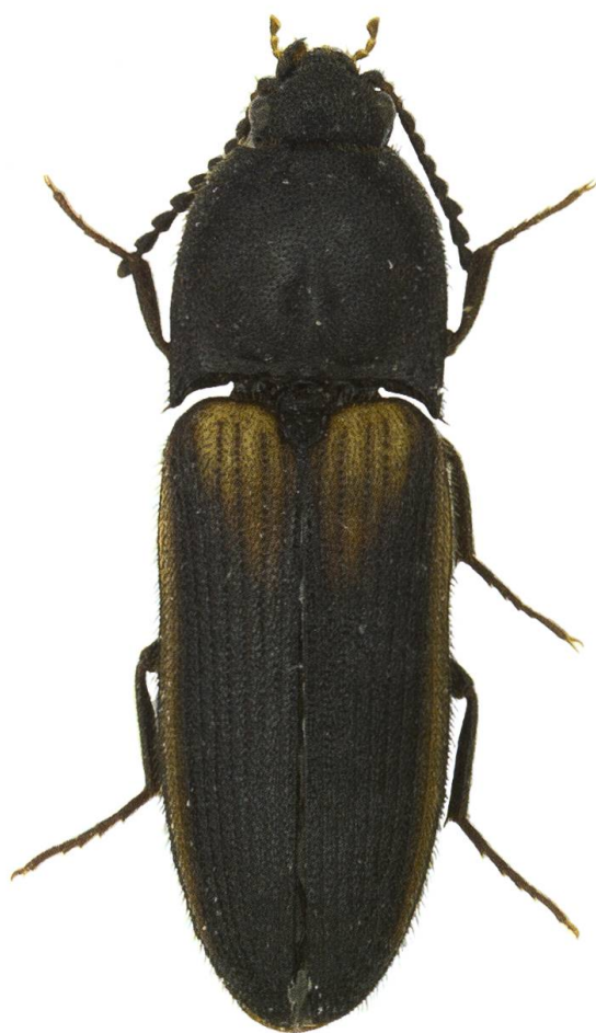
Fig. 2. Habitus de l'individu d' Ampedus tristis (mâle) capturé à Valsot (GR), 9.8 mm.

De distribution euro-sibérienne (Cate 2007), l'espèce est assez bien répandue dans le Nord de l'Europe (Fig. 3). On la connaît ainsi de Scandinavie, des pays baltes et de la Russie européenne jusqu'en Sibérie occidentale. Hors de ces régions boréales, l'espèce est considérée partout comme rare, très rare, voire rarissime (Platia 1994). Elle n'est ainsi connue que de quelques observations, pour certaines très anciennes, de Pologne, de Biélorussie, d'Ukraine, de Roumanie, de Bulgarie, d'Allemagne et d'Autriche. Elle semble un peu plus fréquente en République Tchèque et en Slovaquie. Une donnée valide sa présence au Danemark, quelques-unes en Écosse, et trois très anciennes la