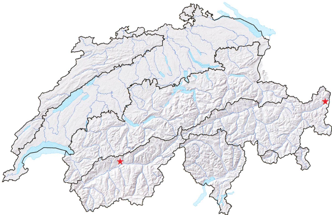
Fig. 4. Localisation des deux observations suisses. Les régions biogéographiques, selon Gonseth et al. (2001), sont indiquées en noir.