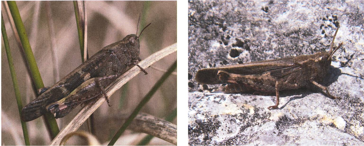
Fig. 2. Oedipode automnale Aiolopus strepens (Latreille, 1804). A gauche: femelle photographiée le 15.03.2008 à La Rippe (585 m) dans un Molinion. A droite: mâle photographié le 29.10.2014 sur les Côtes de Givrins (993 m) sur une zone de falaise en clairière.

centaines de parcelles ont été prospectées dans l'Ouest vaudois, au printemps et surtout entre septembre et novembre. Les milieux prospectés représentent une vaste amplitude altitudinale et sont très divers: prairies maigres à grasses, sèches ou humides, pâturages extensifs ou intensifs, pelouses, bas-marais, haut-marais, zones pionnières, zones rudérales, talus de routes et de voies ferrées, falaises, clairières, ourlets de lisière et cordons boisés, carrières, gravières, vignes, champs. Voici par année respectivement le nombre de parcelles et de communes visitées en automne dans l'Ouest vaudois: 2008 (2 parcelles/2 communes), 2009 (5/5), 2010 (5/5), 2011 (8/8), 2012 (23/15), 2013 (54/35), 2014 (73/35), soit la quasi-totalité des communes du District de Nyon (de Mies à Perroy) et une partie des communes du District de Morges (de Bougy-Villars à Tolochenaz). A cela s'ajoutent trois communes du Lavaux en 2014 (Chexbres, Rivaz et St-Saphorin), six communes du Nord vaudois entre 2012 et 2014 (Juriens, Mathod, Onnens, Romainmôtier-Envy, Vallorbe, Valeyres-sous-Rances), et enfin une commune du Gros de Vaud en 2012 (Echallens). Toutefois il ne s'agit pas d'une recherche exhaustive sur la totalité de la surface de ces communes.