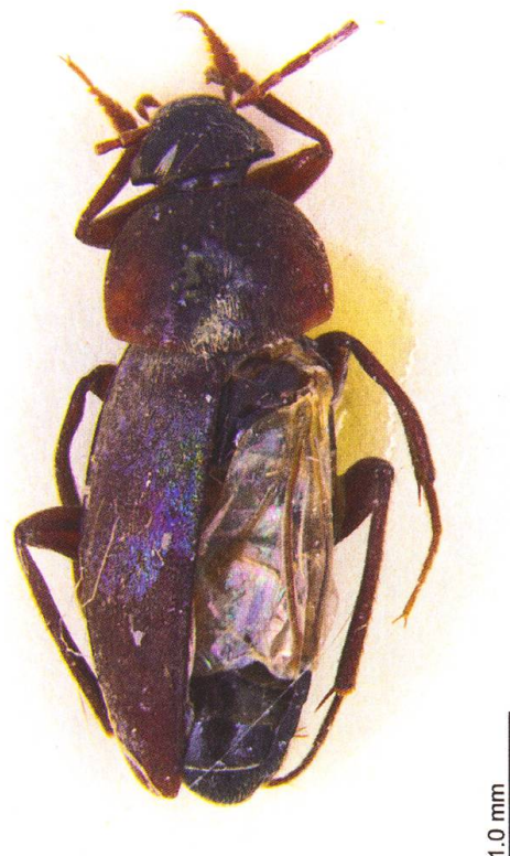
Abb. 2. Choleva agilis (Illiger, 1798) von Romoos, Neumatt, erstmals für die Zentralschweiz gemeldet.