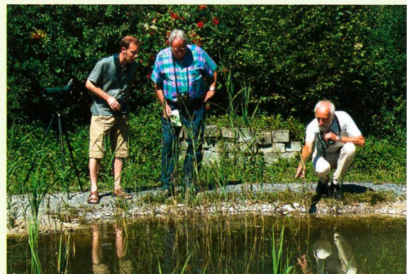
Abb. 4. Auf dem Gelände des Naturschutzzentrums können Besucher bei günstigem Wetter verschiedene Libellenarten und deren Larven direkt vor ihren Füßen beobachten.