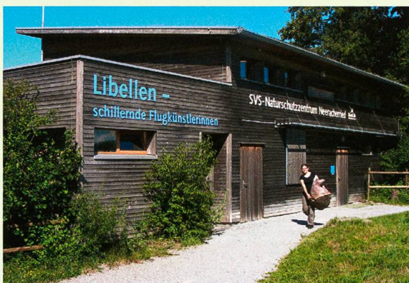
Abb. 1. So präsentiert sich das Naturschutzzentrum Neeracherried während der Sonderausstellung «Libellen – schillernde Flugkünstlerinnen».

Wer nicht auf der Treppe ins obere Stockwerk gelangen möchte, kann einer Larve gleich zum Schlupf einen hölzernen «Schilfhalm» erklimmen, um durch ein blaues Netz als Wasseroberfläche in den Lebensraum der Imagines zu gelangen. Hier fällt zunächst ein riesiges Modell eines fliegenden Männchens der Grossen Königslibelle Anax imperator Leach, 1815 auf, das von der Decke herabhängt. Betätigt man den Hebelmechanismus, senkt sich die Libelle, ergreift mit den sechs Beinen ihre Beute in Form eines Fussballs und steigt anschliessend wieder hoch. Mit dem Stereomikroskop lassen sich die Borsten an den Beinen, die sich zu einem Beutefangkorb schliessen können, an Originalpräparaten im Detail studieren, ebenso die Komplexaugen, Fühler und Flügel