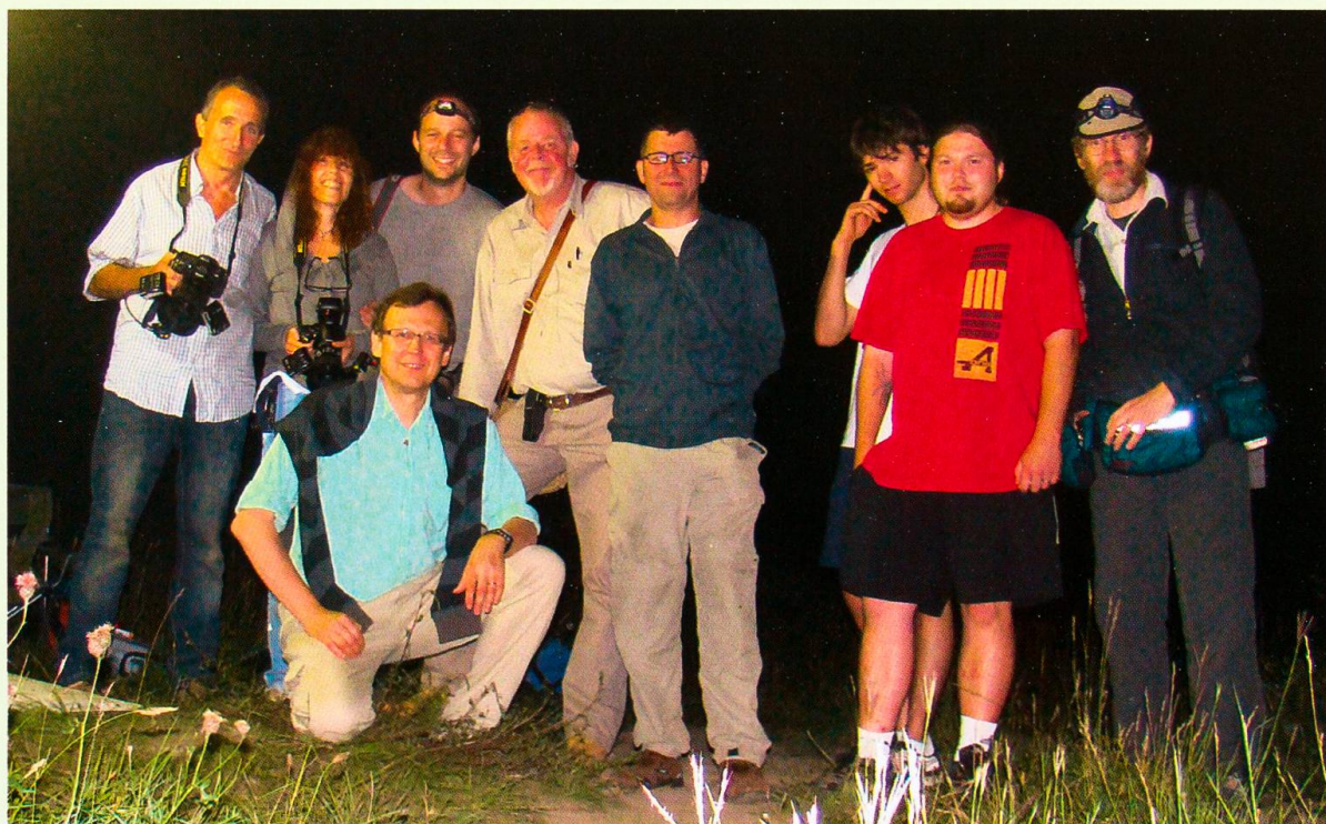
Chasse de nuit dans le canton de Genève (Les Bailleys, vallon de l'Allondon, 27 juin 2011) pour les recensements des macrolépidoptères nocturnes (projet ELPENOR), microlépidoptères et coléoptères.