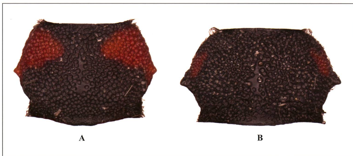
Fig. 2. Pronotum de A) P. globulicollis et B) P. kaehleri . Mêmes individus que Fig. 1.