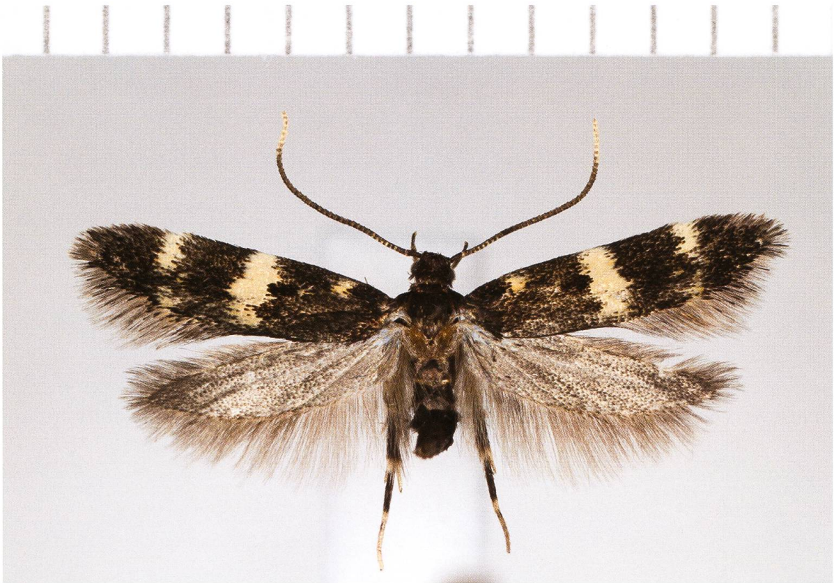
Abb. 3. Apatema whalleyi Popescu-Gorj & Căpușe, 1965