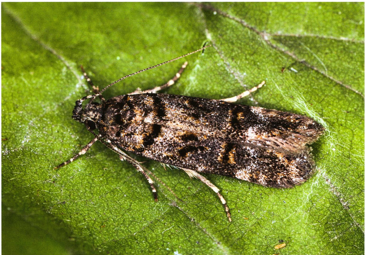
Abb. 4. Teleiopsis laetitia Schmid, 2011