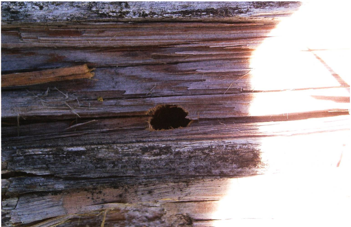
Fig. 1. Trou d'émergence de Tragosoma depsarium (Les Houches).