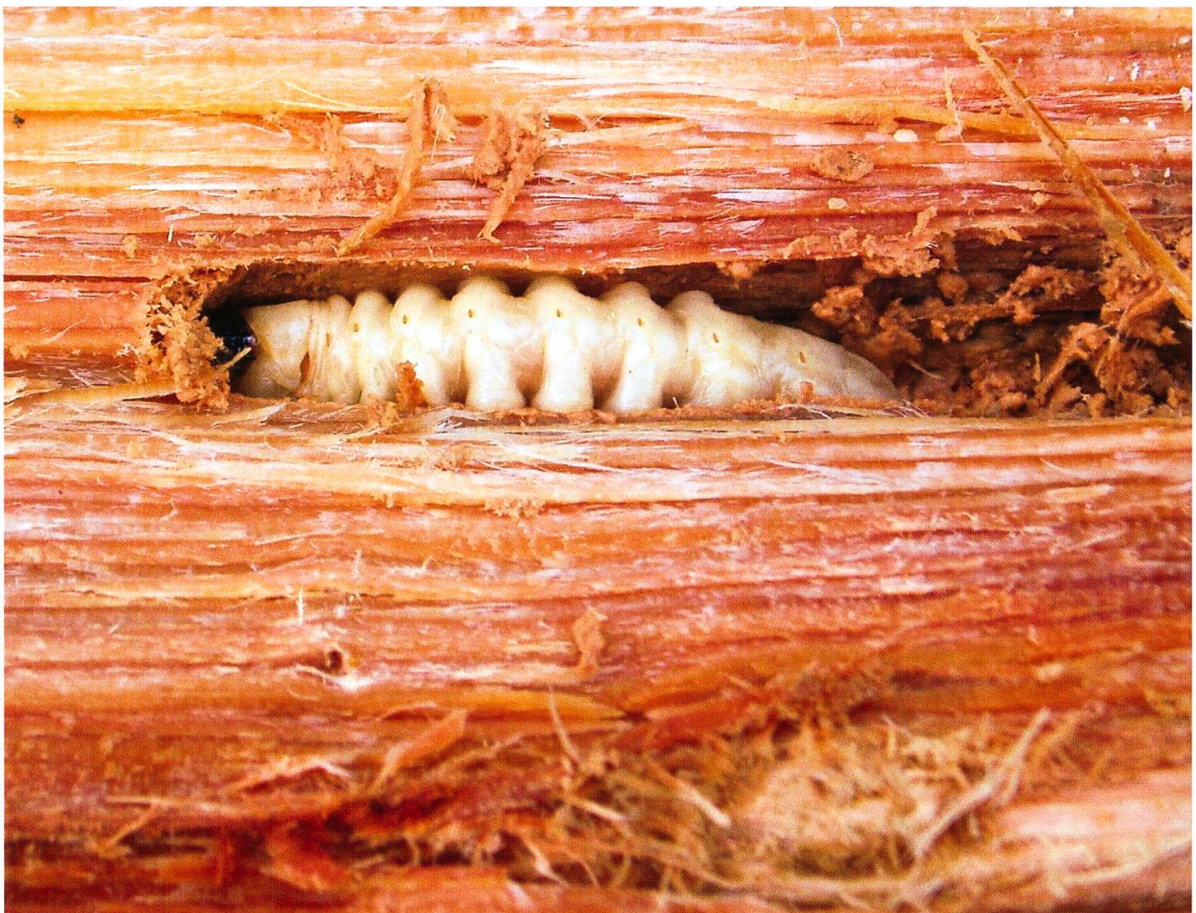
Fig. 2. Larve de Tragosoma depsarium (Les Houches).