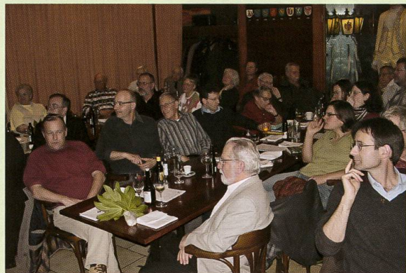
Impressionen von unserer GV