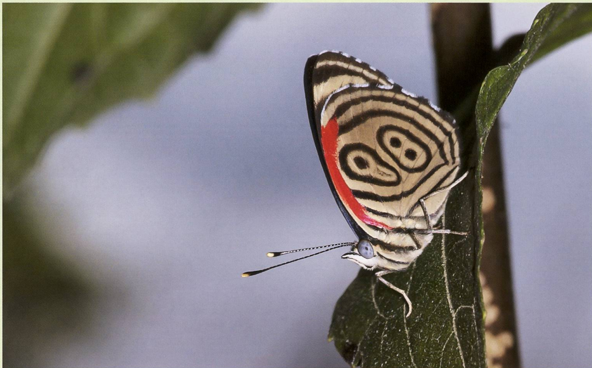
Abb. 3. Diaethria marchalli , Rio Jaris Costa Rica.

Der Vereinsausflug des EVB fand im Berner Oberland bei Gadmen statt. Ein Exkursionsbericht dazu befindet sich in der entsprechenden Rubrik in diesem Band.