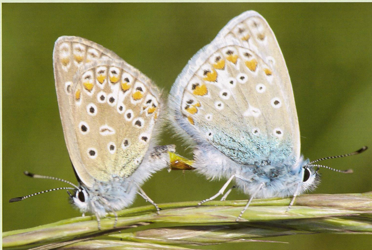
Excursion à la Chassagne d'Onnens: Azurés communs

Local de rencontre Muséum d'Histoire naturelle de Neuchâtel