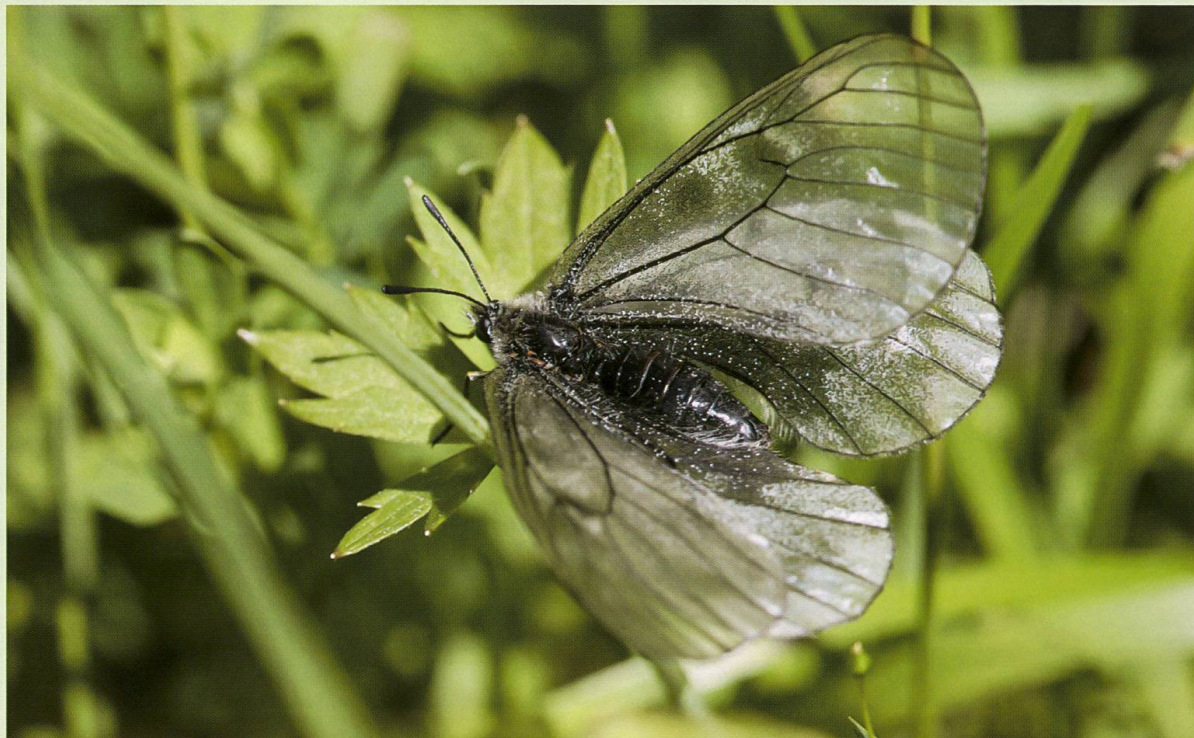
Abb. 1. Ein Weibchen des Schwarzen Apollofalters (Bern, Guttannen, 9.7.2008).

Naturhistorisches Museum, Bernastrasse 15, 3005 Bern